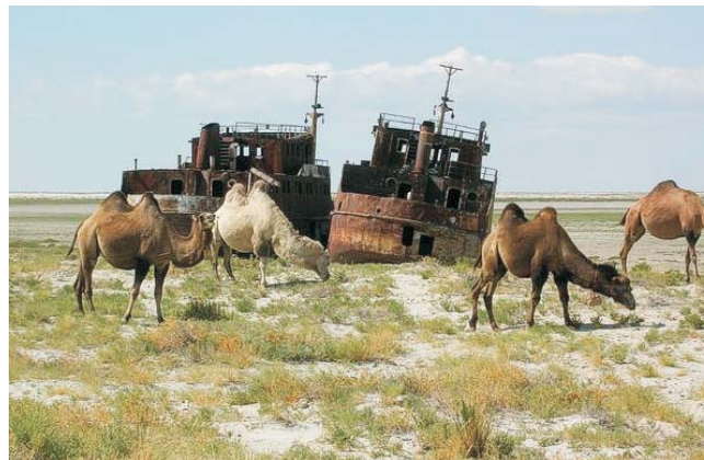
Der Aralsee, 1960 noch viertgrößter Binnensee der Welt, ist beinahe ausgetrocknet. Wo früher Schiffe fuhrten, weiden heute Kamele oder dehnen sich Salzwüsten aus. Grund dafür ist die massive Wasserentnahme aus den beiden einzigen Zuflüssen für den intensiven Bewässerungsanbau von Baumwolle.