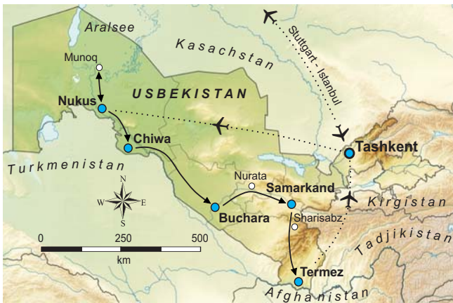
Geopuls-Exkursionsroute Usbekistan lange Strecken werden zeit- und kräfteschonend mit Inlandsflügen überbrückt