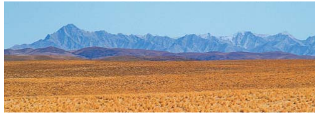
Hochlandsteppe bei Sarmisch

dieser Folder wurde CO 2 - neutral hergestellt