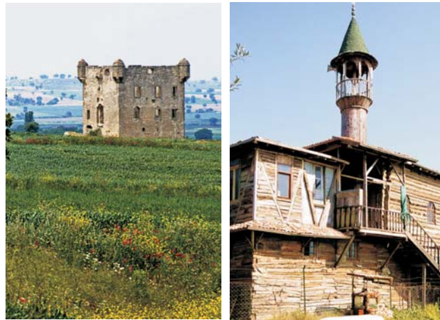
beschauliche Orte der Troas: Hasan-Turm bei Yerksek und Holzmoschee bei Güre

dieser Folder wurde CO 2 -neutral hergestellt