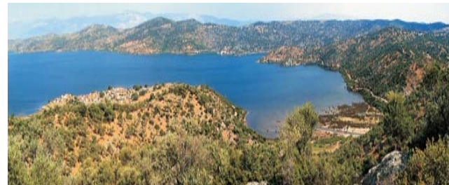
karische Landschaftsszenerie am Bafa-See

GEOPULS als Reiseveranstalter wurde 2004 von Dozenten des Geographischen Instituts in Tübingen gegründet. Durch die Zusammenarbeit mit der VHS bietet sich Ihnen die Gelegenheit, mit uns ein Land intensiv, möglichst authentisch und geographisch ganzheitlich zu erleben. Nicht Reiseleiter von Beruf, sondern begeisterte Geographen und Landeskundler, die sich durch eigene Arbeiten und Erfahrungen im jeweiligen Land bestens auskennen, bilden die Mannschaft von Geopuls. Das Kennenlernen von Kultur und Menschen ist nur die eine Hälfte einer Reise mit Geopuls. Ebensoviele Aufmerksamkeit schenken wir stets der Landesnatur. Ausflüge und kleine Wanderungen in die Natur gehören deshalb zu jeder Reise dazu, um die Besonderheiten von Landschaft, Vegetation, Klima, usw. verstehen und hautnah erleben zu können. Die Gruppengröße ist bewusst stets überschaubar.