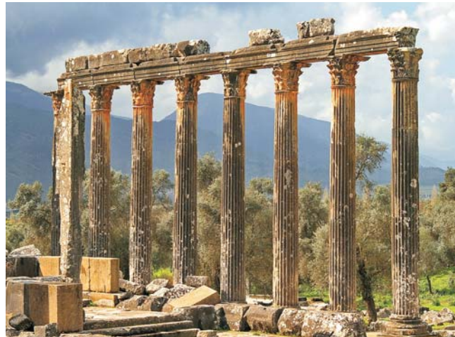
Detail des Zeustempels von Euromos