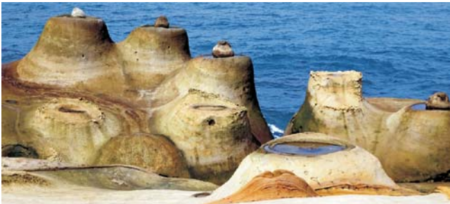
außergewöhnliche und bizarre Küstenformen im Yellu-Geopark

Nach der Anmeldung zu dieser Exkursion wird mit der zugesandten Buchungsbestätigung eine Anzahlung (15 % des Reisepreises) fällig. Die Restzahlung erfolgt zwei Wochen vor Reisebeginn. Es gelten die Geschäftsbedingungen des Veranstalters: Geopuls GbR, Neckarhalde 62, 72108 Rottenburg (Tel. 07472-9808802). Bitte beachten Sie vor Reisebuchung unsere Allgemeinen Reisebedingungen sowie das Formblatt zur Unterrichtung des Reisenden bei einer Pauschalreise nach § 651a des BGB (EU-Richtlinie 2015/2302). Beides schicken wir vor Buchung gerne zu, oder kann auf/von der Webseite www.geopuls.de eingesehen und ausgedruckt werden.