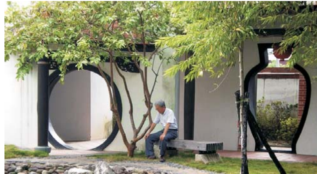
Lin An Tai: Garten-Architektur der Qing-Dynastie aus dem 18. Jh. in Taipei

Sauber wie Japan, locker wie Thailand - nach seiner enormen wirtschaftlichen Entwicklung, gehört Taiwan heute zu den Ländern mit dem höchsten Wohlstand. Der hohe Lebensstandard spiegelt sich in allen Bereichen wider: angefangen bei der hervorragenden Infrastruktur, über das Gesundheitswesen, bis hin zur vorbildlichen Bildungspolitik. Der unglaubliche Reichtum an chinesischen Kulturgütern und die teils atemberaubenden Landschaften dieser großen Insel lohnen auf jeden Fall die Anreise. Von den Portugiesen zu recht Ilha Formosa (die schöne Insel) genannt, lockt Taiwan bis heute mit einer einzigartigen subtropischen Vegetation. Der größte Teil der Insel wird durch Bergmassive mit fast 4000 m Höhe geprägt. Heiße Quellen deuten auf eine recht junge Entstehung - das Gebirge zählt zu den jüngsten weltweit. Ein