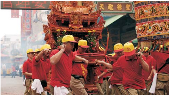
Sänfte mit daoistischer Gottheit auf Reisen