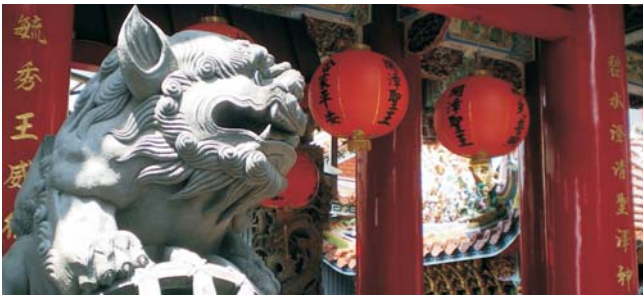
daoistischer Bishan-Tempel im Südosten von Taipei