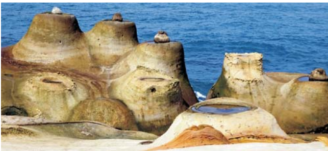
außergewöhnliche und bizarre Küstenformen im Yellu-Geopark

Nach der Anmeldung zu dieser Exkursion wird mit der von GEOPULS zugesandten Buchungsbestätigung eine Anzahlung (15 % des Reisepreises) fällig. Die Restzahlung erfolgt zwei Wochen vor Reisebeginn. Es gelten die Geschäftsbedingungen des Veranstalters: Geopuls GbR, Neckarhalde 62, 72108 Rottenburg (Tel. 07472-9808802). Bitte beachten Sie vor Reisebuchung unsere Allgemeinen Reisebedingungen sowie das Formblatt zur Unterrichtung des Reisenden bei einer Pauschalreise nach § 651a des BGB (EU-Richtlinie 2015/2302). Beides schicken wir vor Buchung gerne zu, oder kann auf/von der Webseite www.geopuls.de eingesehen und ausgedruckt werden.