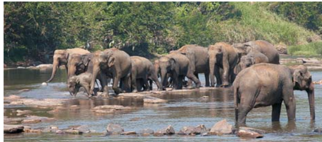
Sri Lankas Nationalparke bewahren ein tropische Inselparadies mit einer Vielzahl an Tieren und einer außergewöhnlichen Pflanzenwelt