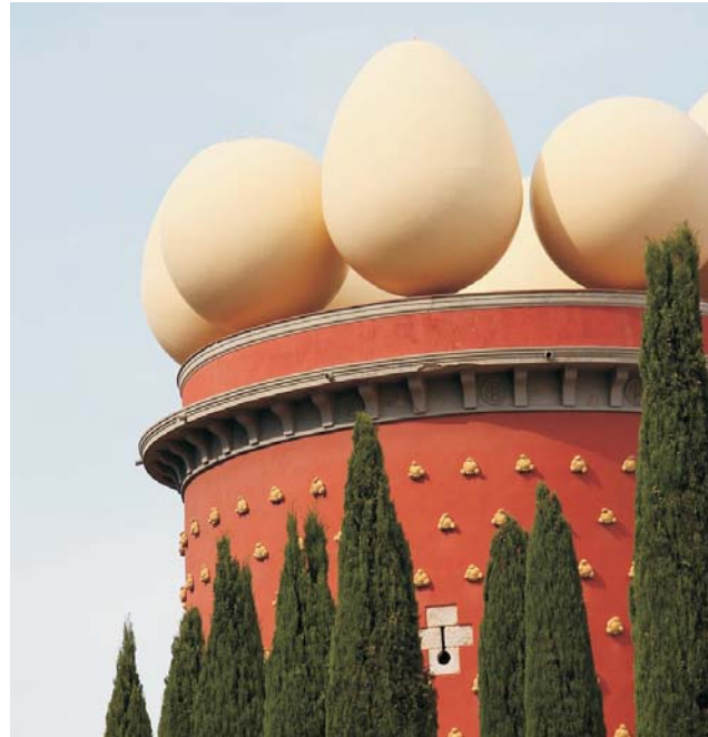
Teatre-Museum Dalí in Figueres

Die nach Unabhängigkeit strebende autonome Region Katalonien unterscheidet sich mit ihren historischen und kulturellen Besonderheiten stark vom übrigen Spanien. Mit einer eigenen Sprache, dem Katalan, das auch in Valencia, auf den Balearen, im französischen Roussillon und in Andorra (Ausflug!) gesprochen wird, wurde 1516 Katalonien mit Kastilien zum Königreich Spanien geeint. Von den Pyrenäen, mit dem 3.143 m hohen Pica d'Estats, erstreckt sich Katalonien über sehr abwechslungsreiche Landschaften mit einigen der bedeutendsten Naturparks der Iberischen Halbinsel, über die Zentralkatalanische Senke, isolierten Massiven, das Küstengebirge mit dem berühmten Benediktinerkloster Montserrat, bis hin zum Mittelmeer mit der felsigen Costa Brava und den weiten Sandstränden der Costa Dorada. Die katalanische Kultur hat bekannte Künstler (Dalí, Gaudí, Miró) und einzigartige Städte, wie z.B. Girona, Figueres, oder Tarragona, hervorgebracht.