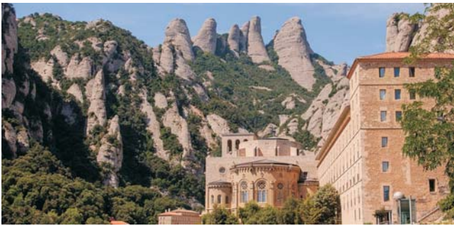
Kloster Montserrat im gleichnamigen Gebirge