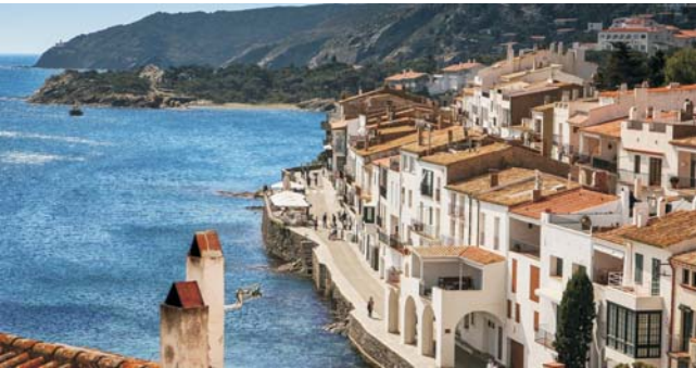
Cadaqués - malerischer Mittelmeerort an der Costa Brava

Nach der Anmeldung zu dieser Exkursion wird mit der von GEOPULS zugesandten Buchungsbestätigung eine Anzahlung (15 % des Reisepreises) fällig. Die Restzahlung erfolgt zwei Wochen vor Reisebeginn. Es gelten die Geschäftsbedingungen des Veranstalters: Geopuls GbR, Neckarhalde 62, 72108 Rottenburg (Tel. 07472-9808802). Bitte beachten Sie vor Reisebuchung unsere Allgemeinen Reisebedingungen sowie das Formblatt zur Unterrichtung des Reisenden bei einer Pauschalreise nach § 651a des BGB (EU-Richtlinie 2015/2302). Beides schicken wir vor Buchung gerne zu, oder kann auf/von der Webseite www.geopuls.de eingesehen und ausgedruckt werden.