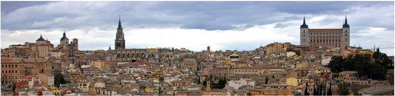
Blick über die Altstadt von Toledo mit Alcazar und Kathedrale