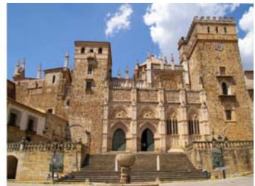
Bilder von links nach rechts: Plaza Mayor von Trujillo mit Pizarro-Denkmal, Blick über die blühende Landschaft der Sierra de Guadalupe, Kreuzgang im Kloster Nuestra Señora de Guadalupe, Eingangsportal zur Kirche des Klosters Nuestra Señora de Guadalupe