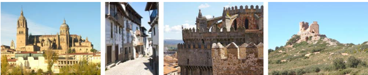
Bilder von links nach rechts: die Kathedrale von Salamanca, Gassen eines alten kastilischen Dorfes, Stadtmauer von Ávila, Castillo de dos Hermanas

Unterkunft im Hotel in der Altstadt von Salamanca (3 Nächte).