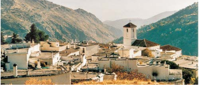
im uralten Bergdorf Capileira in den Alpujarras beziehen wir Quartier in 1435m Höhe

Nach der Anmeldung zu dieser Exkursion wird mit der von GEOPULS zugesandten Buchungsbestätigung eine Anzahlung (15% des Reisepreises) fällig. Die Restzahlung erfolgt zwei Wochen vor Reisebeginn. Es gelten die Geschäftsbedingungen des Veranstalters: Geopuls GbR, Neckarhalde 62, 72108 Rottenburg (Tel. 07472-9808802). Bitte beachten Sie vor Reisebuchung unsere Allgemeinen Reisebedingungen sowie das Formblatt zur Unterrichtung des Reisenden bei einer Pauschalreise nach § 651a des BGB (EU-Richtlinie 2015/2302). Beides schicken wir vor Buchung gerne zu, oder kann auf/ von der Webseite www.geopuls.de eingesehen und ausgedruckt werden.