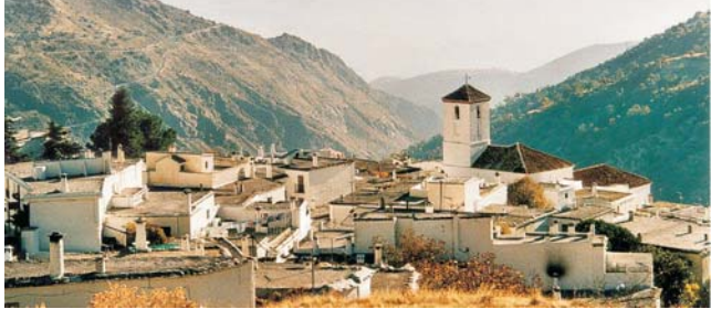
im uralten Bergdorf Capileira in den Alpujarras beziehen wir Quartier in 1435m Höhe

Nach der Anmeldung zu dieser Exkursion wird mit der von GEOPULS zugesandten Buchungsbestätigung eine Anzahlung (15% des Reisepreises) fällig. Die Restzahlung erfolgt zwei Wochen vor Reisebeginn. Es gelten die Geschäftsbedingungen des Veranstalters: Geopuls GbR, Neckarhalde 62, 72108 Rottenburg (Tel. 07472-9808802). Bitte beachten Sie vor Reisebuchung unsere Allgemeinen Reisebedingungen sowie das Formblatt zur Unterrichtung des Reisenden bei einer Pauschalreise nach § 651a des BGB (EU-Richtlinie 2015/2302). Beides schicken wir vor Buchung gerne zu, oder kann auf/ von der Webseite www.geopuls.de eingesehen und ausgedruckt werden.