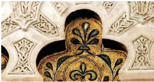
Detail Vielpassbogen im Mihrab der Mezquita, Córdoba

Nach der Anmeldung zu dieser Exkursion wird mit der von GEOPULS zugesandten Buchungsbestätigung eine Anzahlung (15% des Reisepreises) fällig. Die Restzahlung erfolgt zwei Wochen vor Reisebeginn. Es gelten die Geschäftsbedingungen des Veranstalters: Geopuls GbR, Neckarhalde 62, 72108 Rottenburg (Tel. 07472-9808802). Bitte beachten Sie vor Reisebuchung unsere Allgemeinen Reisebedingungen sowie das Formblatt zur Unterrichtung des Reisenden bei einer Pauschalreise nach § 651a des BGB (EU-Richtlinie 2015/2302). Beides schicken wir vor Buchung gerne zu, oder kann auf/ von der Webseite www.geopuls.de eingesehen und ausgedruckt werden.