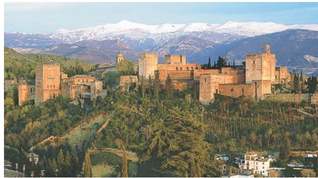
die Alhambra von Granada im Abendlicht mit den Bergen der Sierra Nevada

dieser Folder wurde CO 2 -neutral hergestellt