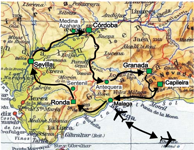
Geopuls-Exkursionsroute Andalusien ■ Übernachtungsorte ● sonstige wichtige Station