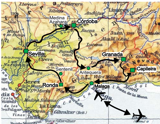
Geopuls-Exkursionsroute Andalusien ■ Übernachtungsorte ● sonstige wichtige Station