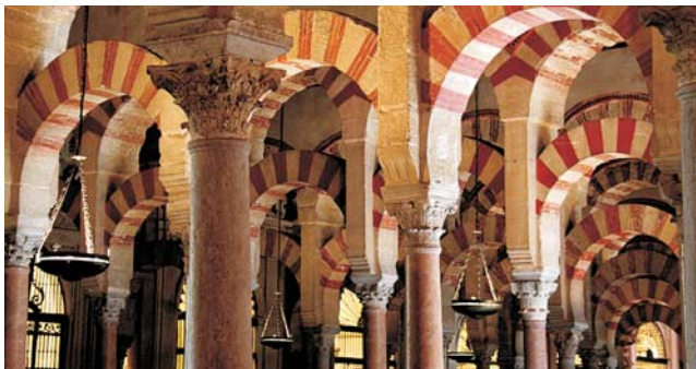
Moschee und Kathedrale zugleich - die Mezquita von Córdoba

Unsere Aufmerksamkeit gilt genauso der Vielfalt an außergewöhnlichen Naturlandschaften. Einige Ausflüge mit kleinen Wanderungen/Spaziergängen und Stopps unterwegs, führen uns immer wieder auch zu den Sehenswürdigkeiten der Natur. Die Gebirgslandschaften der Sierra Nevada und der Alpujarra Alta mit den berühmten weißen Dörfern und Relikten einstiger maurischer Besiedlung stehen ebenso auf dem Programm wie die faszinierenden tief zerschnittenen Plateaulandschaften der subbetischen Cordillere oder die bizarre Karstlandschaft im Naturreservat des El Torcal. Um das Flair der berühmten Städte Andalusiens so authentisch wie möglich einzufangen, beziehen wir Unterkunft in charmanten Hotels inmitten der historischen Altstädte und einmal auch auf einer, heute in ein Hotel umgewandelten, ehemaligen Finca in den Alpujarras.