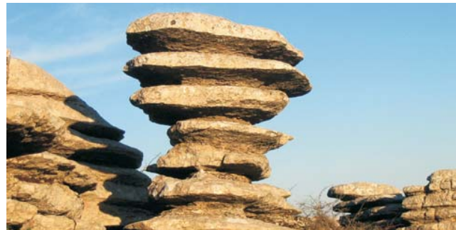
im Karstgebiet des El Torcal bei Antequera

GEOPULS als Veranstalter für alle am Reisen interessierten Menschen wurde 2004 von Dozenten des Geographischen Instituts in Tübingen gegründet und arbeitet seitdem mit der vhs zusammen. Begeisterte Geographen und Landeskundler, die Natur, Kultur und Hintergründe eines Ziellandes bestens vermitteln können, führen Sie bei diesen Exkursionen. Wir versuchen dabei, ein Land möglichst umfassend zu bereisen, was bedeutet, dass neben den berühmten Sehenswürdigkeiten auch die Landesnatur Beachtung und Erklärung findet. Kleine Wanderungen und Spaziergänge in die Natur bieten deshalb immer wieder eine schöne und interessante Abwechslung zum Kulturprogramm. Nicht zuletzt gilt es dabei auch, die so oft übersehenen kleinen Dinge zu entdecken. Dies funktioniert am besten in einer überschaubaren Gruppe, weshalb die Teilnehmerzahl auf 16 Personen begrenzt ist.