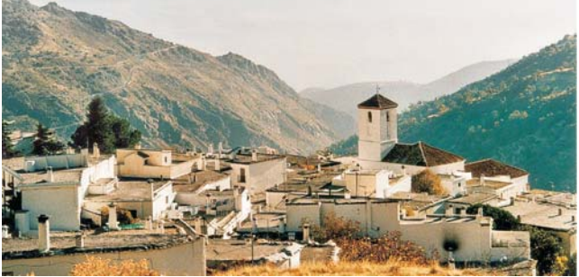
das urige Bergdorf Capileira in den Alpujarras wo wir 2 Tage Quartier nehmen

Komplettpreis pro Person im DZ: 2180 € , EZ +440 € max. Teilnehmerzahl: 16 Personen