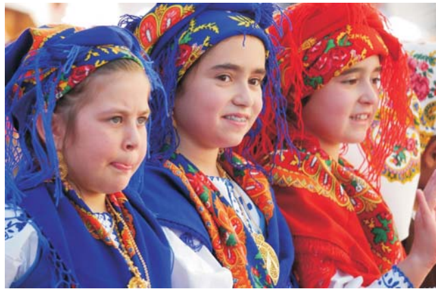
Kinder in traditionelle Kleidung in Viana do Castelo

dieser Folder wurde CO 2 -neutral hergestellt