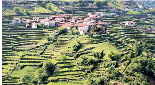
Terrassenlandschaft im äußersten Norden Portugals um Sistelo

So ursprünglich das Land, so alt ist der geologische Unterbau mit Graniten aus dem Erdaltertum, die zu den ältesten Gesteinen Europas zählen. Einen einmaligen Reiz hat an vielen Orten das Verschmelzen der daraus errichteten Bauwerke mit ihrer natürlichen Umgebung. Die Art zu Wirtschaften schlägt sich überall in der Landschaft nieder und führt zu teils großartigen Anblicken, wie z.B. dem mitunter an Tibet erinnernden Terrassenfeldbau bei Sistelo. Weitgehend unbekannte Perlen aber auch UNESCO-Welterbestätten liegen auf unserer Route: Gleich zu Beginn eine Stippvisite mit Bootsfahrt im historischen Porto, die Wallfahrtskirche Bom Jesus do Monte in Braga, der Nationalpalast in Mafra, die prähistorischen Felszeichnungen im Vale do Coa und die Weinregion Alto Douro, die eine oder andere Weinprobe eingeschlossen.