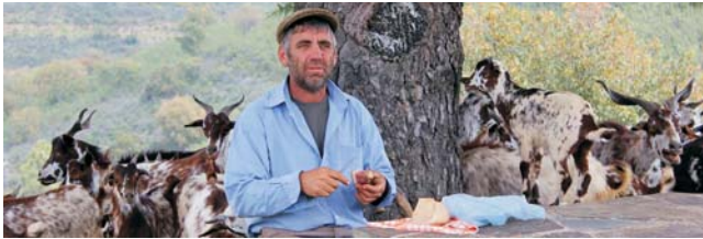
Hirte mit seinen Ziegen bei einer Brotzeit

Nach der Anmeldung zu dieser Reise wird mit der von GEOPULS zugesandten Buchungsbestätigung eine Anzahlung (15 % des Reisepreises) fällig. Die Restzahlung erfolgt zwei Wochen vor Reisebeginn. Es gelten die Geschäftsbedingungen des Veranstalters: Geopuls GbR, Neckarhalde 62, 72108 Rottenburg (Tel. 07472-9808802). Bitte beachten Sie vor Reisebuchung unsere Allgemeinen Reisebedingungen sowie das Formblatt zur Unterrichtung des Reisenden bei einer Pauschalreise nach § 651a des BGB (EU-Richtlinie 2015/2302). Beides schicken wir gerne vor Buchung zu oder kann auf/von der Geopuls-Homepage eingesehen oder ausgedruckt werden. www.geopuls.de