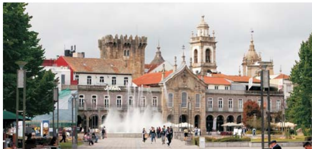
Stadtzentrum von Braga

GEOPULS als Veranstalter für alle, am wirklichen Reisen interessierten Menschen, wurde 2004 von ehemaligen Dozenten des Geographischen Instituts in Tübingen, gegründet. Geopuls arbeitet seitdem ausschließlich mit der vhs zusammen. Begeisterte Geographen und Landeskundler, die Natur, Kultur und Hintergründe eines Ziellandes bestens vermitteln können, führen Sie bei diesen Exkursionen. Wir versuchen dabei, ein Land möglichst umfassend zu bereisen, was bedeutet, dass neben den berühmten Sehenswürdigkeiten auch die Landesnatur Beachtung und Erklärung findet. Kleine Wanderungen und Spaziergänge in die Natur bieten deshalb immer wieder eine schöne und interessante Abwechslung zum Kulturprogramm. Nicht zuletzt gilt es, ein Land so authentisch wie möglich zu erfahren und dabei auch die oft übersehenen kleinen Dinge zu entdecken. Dies funktioniert am besten in einer überschaubaren Gruppe, weshalb die Teilnehmerzahl bei dieser Reise auf 16 Personen begrenzt ist.