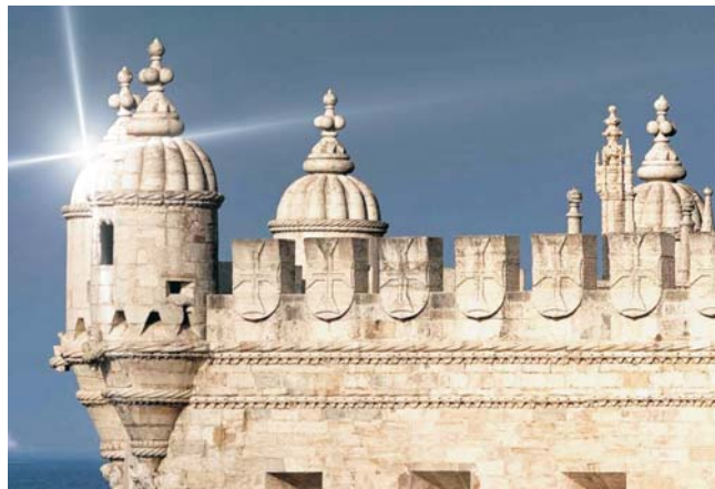
Wahrzeichen von Lissabon: Torre de Belém (Detail)

dieser Folder wurde CO 2 -neutral hergestellt