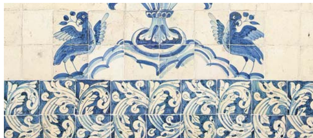
Ausschnitt Azulejo-Wanddekoration in Coimbra

GEOPULS als Veranstalter für alle am wirklichen Reisen interessierten Menschen, wurde 2004 von ehemaligen Dozenten des Geographischen Instituts in Tübingen gegründet. Geopuls arbeitet seitdem mit der vhs zusammen. Begeisterte Geographen und Landeskundler, die Natur, Kultur und Hintergründe eines Ziellandes bestens vermitteln können, führen Sie bei diesen Exkursionen. Wir versuchen dabei, ein Land möglichst umfassend zu bereisen, was bedeutet, dass neben den berühmten Sehenswürdigkeiten auch die Landesnatur Beachtung findet. Kleine Wanderungen und Spaziergänge in die Natur bieten deshalb immer wieder eine schöne und interessante Abwechslung zum Kulturprogramm. Nicht zuletzt gilt es, ein Land so authentisch wie möglich zu erfahren und dabei auch die oft übersehenen kleinen Dinge zu entdecken. Dies funktioniert am besten in einer überschaubaren Gruppe, weshalb die Teilnehmerzahl auf 16 begrenzt ist.