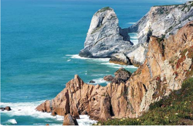
Blick auf die Atlantikküste am Cabo da Roca