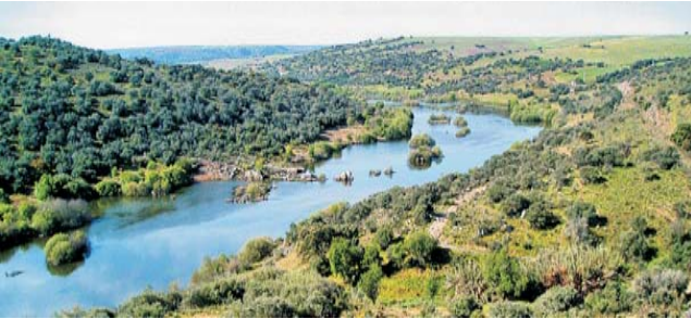
Der Fluss Guadiana in der Nähe von Serpa

Nach der Anmeldung zu dieser Reise wird mit der von GEOPULS zugesandten Buchungsbestätigung eine Anzahlung (15 % des Reisepreises) fällig. Die Restzahlung erfolgt zwei Wochen vor Reisebeginn. Es gelten die Geschäftsbedingungen des Veranstalters: Geopuls GbR, Neckarhalde 62, 72108 Rottenburg (Tel. 07472-9808802). Bitte beachten Sie vor Reisebuchung unsere Allgemeinen Reisebedingungen sowie das Formblatt zur Unterrichtung des Reisenden bei einer Pauschalreise nach § 651a des BGB (EU-Richtlinie 2015/2302). Beides schicken wir gerne vor Buchung zu oder kann auf/von der Geopuls-Homepage eingesehen oder ausgedruckt werden. www.geopuls.de