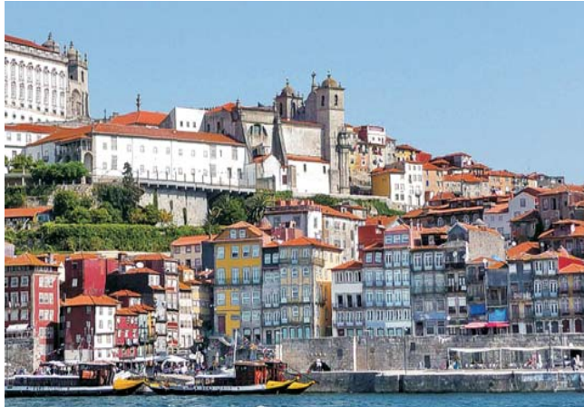
Blick vom Fluss Douro auf die Altstadt von Porto

die berühmte Straßenbahn in der historischen Altstadt von Lissabon existiert seit 1873