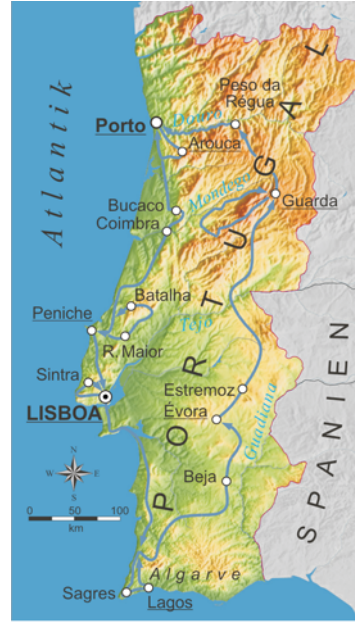
Geopuls-Route, unterstrichen = Übernachtungsorte