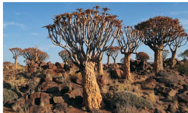
Köcherbäume ( Aloe dichotoma )

GEOPULS als Reiseveranstalter wurde 2004 von Dozenten des Geographischen Instituts in Tübingen gegründet und arbeitet seitdem mit ausgewählten Volkshochschulen zusammen. Begeisterte Geographen, die ein Land durch Ihre Arbeit während vieler Aufenthalte von allen Seiten kennen gelernt haben, führen Sie durch Kultur und Natur des jeweiligen Reisezieles. Bei einer Reise mit Geographen gibt es, neben den touristischen Höhepunkten, immer noch etwas mehr zu sehen und zu erleben. Wenig Bekanntes, tiefe Einblicke, das Erkennen von Zusammenhängen in Kultur- und Naturraum, Hintergründiges. Ausflüge in die Natur mit der einen oder anderen kleinen Wanderung gehören dazu, um auch die landschaftlichen Besonderheiten und deren Schönheit kennenzulernen und zu genießen. Die Teilnehmerzahl ist je nach Reise auf angenehme 12 bis max. 16 Personen beschränkt, was auch noch ein Reisen abseits massentouristischer Strukturen ermöglicht.