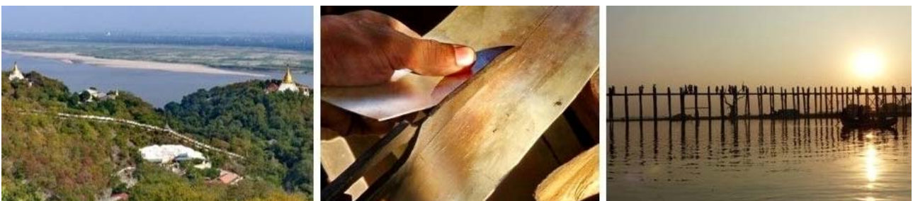
von links nach rechts: Blick auf den Irrawaddy vom Saigain Hill, Silberschmied (Sagaing), Sonnenuntergang mit U-Bein-Brücke (Taungthaman-See)

Nach dem Frühstück Besichtigung des hölzernen Shwenandaw-Palasts bei Mandalay, der Stupas der Sandamani Pagode am Kuthodaw-See und der Kuthodaw-Pagode mit dem Pali-Kanon, dem größte Buch der Welt (729 pavillonartige Inschriften-Schreine). Anschließend besuchen wir die Pagoden Su Taung Pyi und Sun U Ponya Shin auf dem Mandalay Hill mit weitem Blick auf die Ebene mit der Stadt Mandalay, ehe wir zur Besichtigung der Palaststadt (rekonstruierter Königspalast) aufbrechen. Nach dem Mittagessen im Mya Nandar Restaurant am Irrawaddy-Fluss geht es per Boot auf dem Irrawaddy nach Mingung mit Besuch der unvollendeten Patho Dawgyi