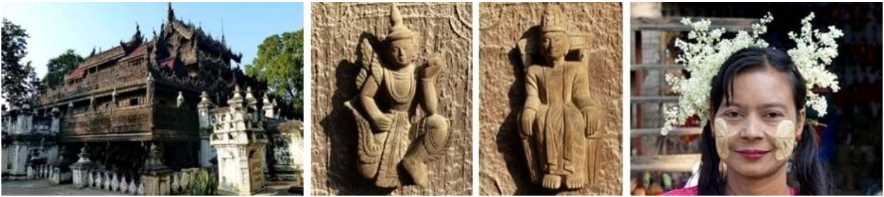
Mandalay, von links nach rechts: Shwenandaw-Palast, Details im Shwenandaw-Palast, bemalte und geschmückte Burmesin

Pagode, der Mingunglocke und der Mya Thein Tan/Hsinbyume-Pagode. Rückfahrt per Boot nach Mandalay. Dort Abendessen und Übernachtung wie am Vortag.