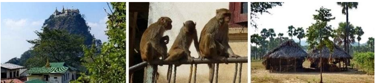
Mt. Ropa, links nach rechts: Klosteberg, Affen und Gehöft bei Natpalindangyin

Nach dem Frühstück unternehmen wir ganztägig eine interessante Bootstour mit traditionellen Langbooten auf dem Inle-See und besuchen dabei u.a. das dort ansässige traditionelle Handwerk: Silberschmiede, Reederei, Teppichknüpfer, Weberei, Lotus-Seidenspinnerei. Wir bummeln über den Thale Phaung Daw Oo-Markt mit Frauen der Pao-Minderheit, der voller Früchte, Gemüse und verschiedensten Souvenirs ist. Wir werden auch die Padaung-Frauen kennenlernen, die Messingringe um den Hals tragen, um diesen zu strecken. Nach der Mittagsrast im Nampay Eayful Lake Restaurant besuchen wir die Nampay Zigarettenmanufaktur, die Se-khong Eisen schmiede und erreichen durch die Schwimmenden Gärten als letzte Station das Nga Pe Chaung Kloster, ehe wir zum Hotel zurückkehren. Abendessen und Übernachtung wie am Vortag.