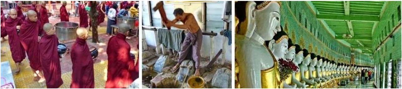
von links nach rechts: Essensausgabe im Mahagandayon-Kloster, Herstellung von Bambuspapier (Mandalay), Umin-Thonze-Pagode (Sagaing Hill)