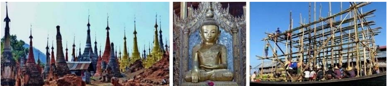
von links nach rechts: Stupas der Inn Thein-Pagode, Buddha im Ngapegyaung Nga Phe Kyaung-Kloster, traditioneller Hausbau am Seeufer

Besichtigung der archäologisch bedeutenden Ruinenstadt aus dem 15. Jh. östlich des Kaladan Flusses, unter dem Namen Mrohaung bis 1785 Hauptstadt des letzten vereinigten Arakan-Königreichs. Mit der Verlegung der britischen Verwaltung im 19. Jh. nach Akyab begann der Verfall und die Stadt bekam den Namen Mrohaung (Alte Stadt). Erst 1979 wurde sie wieder in Mrauk U umbenannt. Die Region ist nach dem Irrawaddy-Delta die zweitwichtigste Reisproduktionsstätte Myanmars. Mittagessen im River Valley Restaurant; Abendessen und Übernachtung wie am Vortag.