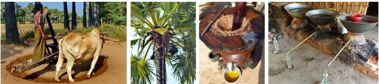
links nach rechts: traditionelle Erdnuss-Mühle, Zuckerpalme, Erdnuss-Öl und Zuckerpalm-Destilat

Landausflug zum Mount Popa aufbrechen. Unterwegs erfahren wir einiges über Erdnuss-Anbau und -Verarbeitung sowie über Ernte und Verarbeitung des Zuckerpalmsafts der asiatischen Palmyrapalme (auch Lontaropalme). Mittagessen mit längerer Ruhepause haben wir im Mountain Popa Resort mit herrlichem Blick auf den Mount Popa und seiner ansehnlichen Klosteranlage, einer der wichtigsten burmesischen Wallfahrtsorte. Alternativ bleibt Gelegenheit über 777 Stufen zum Besteigen des Mount Popa, eines erloschenen Vulkans der sich bei einem gewaltigen Erdbeben 442 v. Chr. etwa 1000 m über der Myingyan-Ebene aufbaute. Anschließend Rückfahrt nach Bagan. Abendessen im Sunset Garden Restaurant am Irrawaddy. Übernachtung wie am Vortag.