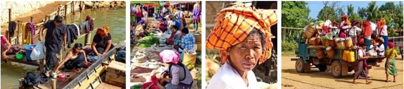
Inle-See, von links nach rechts: Waschtag, Indein Markt, Pa-o-Frau, Pa-o-Frauen mit Kleintransporter

Nach dem Frühstück unternehmen wir eine entspannende Bootsfahrt auf einem kleinen Kanal zum PaO-Dorf Indein. Am Westufer des Sees treffen wir auf viele Fischer und badende Wasserbüffel. Indein mit seinem typischen Mine Thauk Markt ist ein großer, geschäftiger und wichtiger 5-tägiger Markt der Region. Mittagsrast in einem guten Restaurant in Nyaung Ohak am Loi-maw Chaung auf dem Weg zur Shwe Inn Thein Pagode. Der nahe Pagodenhügel ist äußerst besuchenswert. Man passiert eine erste Gruppe zerstörter Stupas im Schatten von Banyan-Bäumen, bekannt als Nyaung Ohak. Die Shwe Inn Thein Pagode (17. Jh.) selbst besitzt eine beeindruckende Sammlung von über 1000 Stupas. Entlang von Bambus-Wäldern geht es zurück zur Anlegestelle und mit dem Boot zurück zum Inle-See. Abendessen und Übernachtung wie am Vortag.