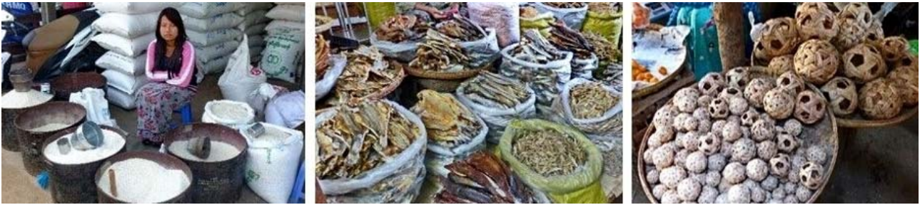
Nyaung Oo-Markt in Pagan, links nach rechts: Reisverkäuferin, Trockenfisch, geflochtene Bälle

Landausflug zum Mount Popa aufbrechen. Unterwegs erfahren wir einiges über Erdnuss-Anbau und -Verarbeitung sowie über Ernte und Verarbeitung des Zuckerpalmsafts der asiatischen Palmyrapalme (auch Lontaropalme). Mittagessen mit längerer Ruhepause haben wir im Mountain Popa Resort mit herrlichem Blick auf den Mount Popa und seiner ansehnlichen Klosteranlage, einer der wichtigsten burmesischen Wallfahrtsorte. Alternativ bleibt Gelegenheit über 777 Stufen zum Besteigen des Mount Popa, eines erloschenen Vulkans der sich bei einem gewaltigen Erdbeben 442 v. Chr. etwa 1000 m über der Myingyan-Ebene aufbaute. Anschließend Rückfahrt nach Bagan. Abendessen im Sunset Garden Restaurant am Irrawaddy. Übernachtung wie am Vortag.