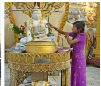
Yangon, von links nach rechts: Liegender Buddha, Nachbau einer königlichen Barke, Opfer in der Shwedagon-Pagode