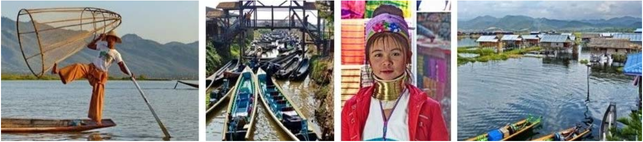
Inle-See, von links nach rechts: Fischer, Bootsparkplatz, Padaung-Frau, Dorf (Nampan) am Seeufer