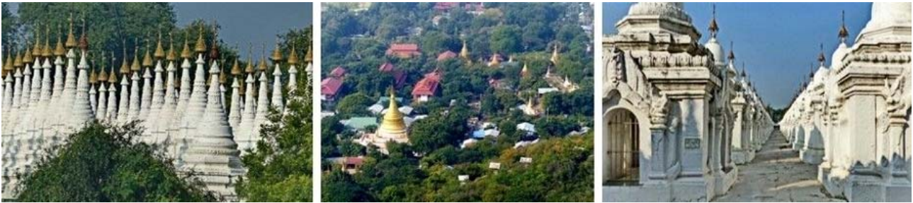
Mandalay, von links nach rechts: Stupas der Sandamani-Pagode und am Mandalay-Hill, Pali-Korn – das größte Buch der Welt (Inscrifen-Schreine)

Pagode, der Mingunglocke und der Mya Thein Tan/Hsinbyume-Pagode. Rückfahrt per Boot nach Mandalay. Dort Abendessen und Übernachtung wie am Vortag.