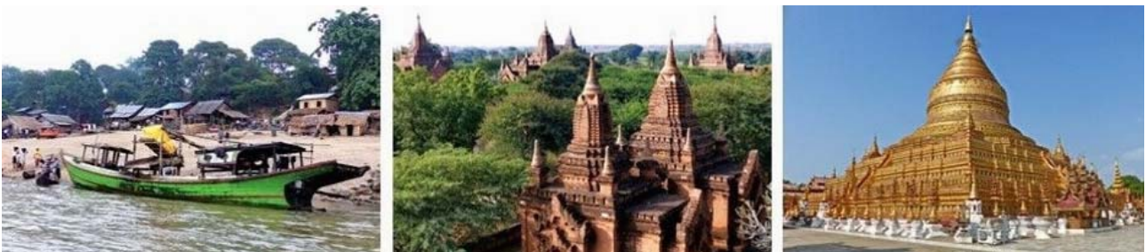
Bagan, links nach rechts: Bootsanlegestelle, Dhammayazika-Pagode, Hauptstupa der Nyaung U Shwe Zigon-Pagode

Nach dem Frühstück und einem Besuch des Schirm- und Flechthandwerks sowie der Lackarbeiten im Bagan House genießen wir das morgendliche Panorama von der Höhe der Dhammayazika-Pagode, ehe wir zu unserem