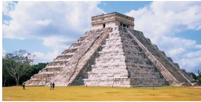
Chichén Itzá: Kukulcán-Pyramide der Maya auf Yucatan

Nach der Anmeldung zu dieser Exkursion wird mit der von GEOPULS zugesandten Buchungsbestätigung eine Anzahlung (15 % des Reisepreises) fällig. Die Restzahlung erfolgt zwei Wochen vor Reisebeginn. Es gelten die Geschäftsbedingungen des Veranstalters: Geopuls-Studienreisen, Neckarhalde 62, 72108 Rottenburg a.N. (Tel. 07472-9808802). Die Allgemeinen Reisebedingungen werden gerne vorab zugeschickt oder können auf/von der Geopuls-Homepage www.geopuls.de eingesehen oder ausgedruckt werden.