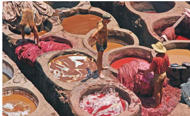
im Färberviertel von Fès

GEOPULS als Veranstalter für alle am Reisen interessierten Menschen wurde 2004 von Dozenten des Geographischen Instituts in Tübingen gegründet. Begeisterte Geographen und Landeskundler, die Natur, Kultur und Hintergründe eines Zielandes bestens vermitteln können, führen Sie bei allen Exkursionen. Wir versuchen dabei, ein Land möglichst umfassend zu bereisen, was bedeutet, dass neben den berühmten Sehenswürdigkeiten auch die Landesnatur Beachtung und Erklärung findet. Kleine Wanderungen, Spaziergänge und Stopp in der Natur bieten deshalb immer wieder eine schöne und interessante Abwechslung zum Kulturprogramm. Nicht zuletzt gilt es, ein Land so authentisch wie möglich zu erfahren und dabei gerade auch die oft übersehenen kleinen Dinge zu entdecken.