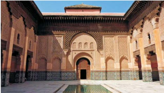
Medersa Ben Youssef, Marrakech

Nach der Anmeldung zu dieser Exkursion wird mit der von GEOPULS zugesandten Buchungsbestätigung eine Anzahlung (15 % des Reisepreises) fällig. Die Restzahlung erfolgt zwei Wochen vor Reisebeginn. Es gelten die Geschäftsbedingungen des Veranstalters: Geopuls GbR, Neckarhalde 62, 72108 Rottenburg. Bitte beachten Sie vor Reisebuchung unsere Allgemeinen Reisebedingungen sowie das Formblatt zur Unterrichtung des Reisenden bei einer Pauschalreise nach § 651a des BGB (EU-Richtlinie 2015/2302). Beides schicken wir vor Buchung gerne zu, oder kann auf der Webseite www.geopuls.de eingesehen und ausgedruckt werden.