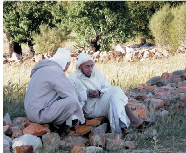
Schwätzchen in einem Mandelhain bei Tafraout im Antiatlas

Marokko ist eines der wenigen islamisch-orientalischen Länder, die immer schon problemlos bereist werden konnten. Zum Glück, denn gerade hier ist das besondere Flair dieser Kultur noch sehr lebendig: in Architektur, Kleidung, Lebens- und Wirtschaftsformen. Allein schon deswegen ist das Land eine mehr als eindrucksvolle Reiseregion. Das Schöne dabei ist, dass Massentourismus nur an ganz wenigen Plätzen eine Rolle spielt. Marokko verführt mit seinen traditionsreichen, lebhaften und faszinierenden Städten, seinen vielfältigen, oft atemberaubenden Landschaften und mit seinen ethnisch vielfältigen Kolorierungen. Auf dem Hintergrund einer Szenerie aus Tausend und einer Nacht pulsiert das tägliche Leben mit seinen bisweilen krassen Gegensätzen zwischen Nord und Süd, zwischen Stadt und Land, zwischen Tradition und Moderne. Intensiv - und nicht selten hautnah - lässt sich so etwas nur auf einer Reise durchs Land erfahren. Auf einer eindrucksvollen und wunderschönen Route bekommen Sie