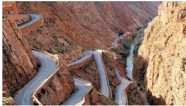
Durchbruch des Flusses Dades am Südrand des Hohen Atlas

dieser Folder wurde CO 2 -neutral hergestellt