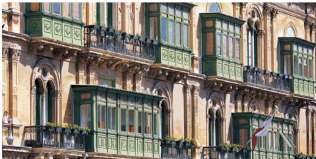
die für ganz Malta typischen Balkone sind ein Erbe aus arabischer Zeit

Nach der Anmeldung zu dieser Exkursion wird mit der zugesandten Buchungsbestätigung eine Anzahlung (15 % des Reisepreises) fällig. Die Restzahlung erfolgt zwei Wochen vor Reisebeginn. Es gelten die Geschäftsbedingungen des Veranstalters: Geopuls-Studienreisen, Neckarhalde 62, 72108 Rottenburg (Tel. 07472-9808802). Die Allgemeinen Reisebedingungen werden auf Wunsch vorab zugeschickt, oder können unter www.geopuls.de ausgedruckt werden.