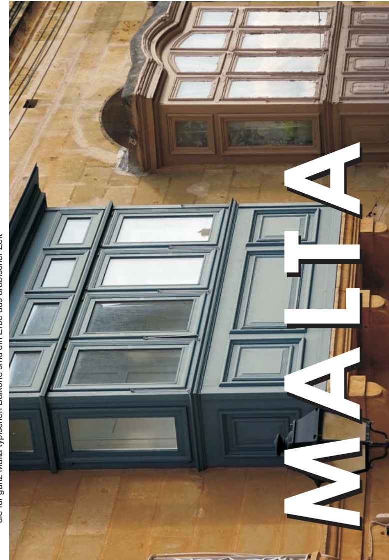
die für ganz Malta typischen Balkone sind ein Erbe aus arabischer Zeit

dem Reiseveranstalter, gegründet aus dem Geographischen Institut der Uni Tübingen