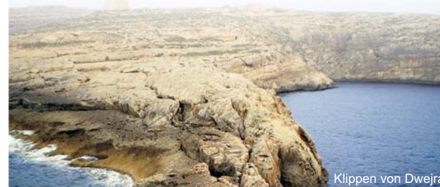
Klippen von Dwejra

GEOPULS wurde 2004 von Dozenten des Geographischen Instituts in Tübingen gegründet und veranstaltet seit 2012 gemeinsam mit dem Landesverband der Deutschen Schulgeographen NRW Exkursionen in alle Welt, mit dem Ziel kulturell und naturräumlich ganz unterschiedliche Regionen der Erde mit der ganzen Bandbreite geographischer Inhalte zu erleben. Bei allen Exkursionen werden Sie deshalb von landeskundigen Hochschulgeographen geführt, die, durch ihre Erfahrungen, zu Natur und Kultur des jeweiligen Exkursionszieles umfassende geographische Inhalte vermitteln können.