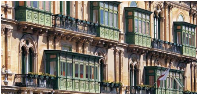
die für ganz Malta typischen Balkone sind ein Erbe aus arabischer Zeit

Nach der Anmeldung zu dieser Exkursion wird mit der von GEOPULS zugesandten Buchungsbestätigung eine Anzahlung (15 % des Reisepreises) fällig. Die Restzahlung erfolgt zwei Wochen vor Reisebeginn. Es gelten die Geschäftsbedingungen des Veranstalters: Geopuls-Studienreisen, Neckarhalde 62, 72108 Rottenburg a.N. (Tel. 07472-9808802). Die Allgemeinen Reisebedingungen werden gerne vorab zugeschickt. Sie können bei der VHS eingesehen, oder auch von der Homepage www.geopuls.de ausgedruckt werden.