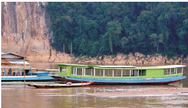
Boot auf dem Mekong / Laos