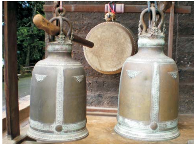
Wat Phra That Pu Khao, Mae Sai / Mekong

GEOPULS wurde 2004 von Dozenten des Geographischen Instituts in Tübingen gegründet und arbeitet seitdem mit der vhs zusammen. Begeisterte Geographen und Landeskundler, die Natur, Kultur und Hintergründe eines Ziellandes bestens vermitteln können, führen Sie bei diesen Exkursionen. Wir versuchen dabei, ein Land möglichst umfassend zu bereisen, was bedeutet, dass neben den berühmten Sehenswürdigkeiten auch die Landesnatur Beachtung und Erklärung findet. Kleine Wanderungen und Spaziergänge in die Natur bieten deshalb immer wieder eine schöne und interessante Abwechslung zum Kulturprogramm. Nicht zuletzt gilt es, ein Land so authentisch wie möglich zu erfahren und dabei auch die oft übersehenen kleinen Dinge zu entdecken. Dies funktioniert bei dieser Exkursion am besten in einer überschaubaren Gruppe von nicht mehr als 16-17 Teilnehmern.