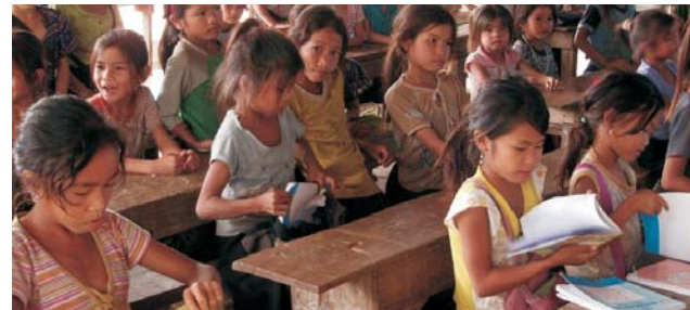
Mädchenklasse einer Grundschule

GEOPULS wurde 2004 von Dozenten des Geographischen Instituts in Tübingen gegründet und arbeitet seitdem mit der vhs zusammen. Begeisterte Geographen und Landeskundler, die Natur, Kultur und Hintergründe eines Ziellandes bestens vermitteln können, führen Sie bei diesen Exkursionen. Wir versuchen dabei, ein Land möglichst umfassend zu bereisen, was bedeutet, dass neben den berühmten Sehenswürdigkeiten auch die Landesnatur Beachtung und Erklärung findet. Kleine Wanderungen und Spaziergänge in die Natur bieten deshalb immer wieder eine schöne und interessante Abwechslung zum Kulturprogramm. Nicht zuletzt gilt es, ein Land so authentisch wie möglich zu erfahren und dabei auch die oft übersehenen kleinen Dinge zu entdecken. Dies funktioniert bei dieser Exkursion am besten in einer überschaubaren Gruppe von nicht mehr als 16-17 Teilnehmern.