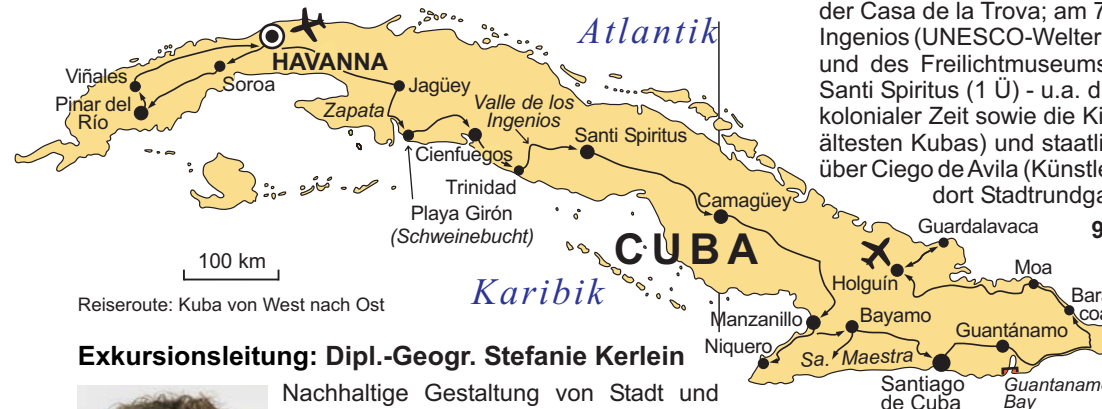
Reiseroute: Kuba von West nach Ost

GEOPULS als Reiseveranstalter wurde 2004 von Dozenten des Geographischen Instituts in Tübingen gegründet und arbeitet seitdem mit ausgewählten Volkshochschulen zusammen. Begeisterte Geographen, die ein Land durch Ihre Arbeit während vieler Aufenthalte von allen Seiten kennen gelernt haben, führen Sie durch Kultur und Natur des jeweiligen Reisezieles. Bei einer Reise mit Geographen gibt es, neben den touristischen Höhepunkten, immer noch etwas mehr zu sehen und zu erleben. Wenig Bekanntes, tiefe Einblicke, das Erkennen von Zusammenhängen in Kultur- und Naturraum, Hintergründiges. Ausflüge in die Natur mit der einen oder anderen kleinen Wanderung gehören dazu, um auch die landschaftlichen Besonderheiten und deren Schönheit kennenzulernen und zu genießen. Die Teilnehmerzahl ist je nach Reise auf angenehme 12 bis max. 16 Personen beschränkt, was auch noch ein Reisen abseits massentouristischer Strukturen ermöglicht.