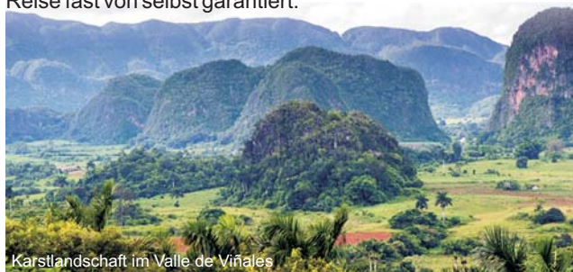
Karstlandschaft im Valle de Viñales