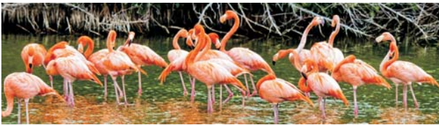
Flaminos in der Mangrove (Zapata-Halbinsel)

Nach der Anmeldung zu dieser Exkursion wird mit der von GEOPULS zugesandten Buchungsbestätigung eine Anzahlung (15 % des Reisepreises) fällig. Die Restzahlung erfolgt zwei Wochen vor Reisebeginn. Es gelten die Geschäftsbedingungen des Veranstalters: Geopuls GbR, Neckarhalde 62, 72108 Rottenburg (Tel. 07472-9808802). Bitte beachten Sie vor Reisebuchung unsere Allgemeinen Reisebedingungen sowie das Formblatt zur Unterrichtung des Reisenden bei einer Pauschalreise nach § 651a des BGB (EU-Richtlinie 2015/2302). Beides schicken wir vor Buchung gerne zu, oder kann auf/von der Webseite www.geopuls.de eingesehen und ausgedruckt werden.