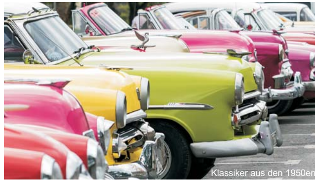
Klassiker aus den 1950ern

dieser Folder wurde CO 2 -neutral hergestellt