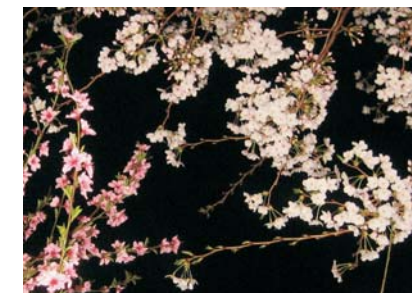
Kirschblüte im Süden Japans