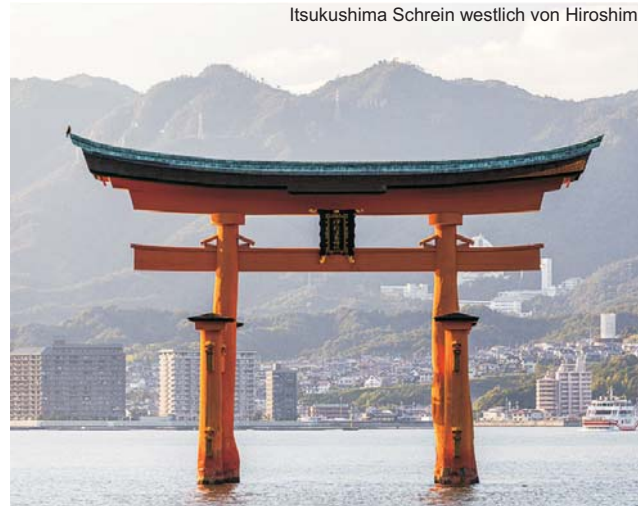
Itsukushima Schrein westlich von Hiroshima