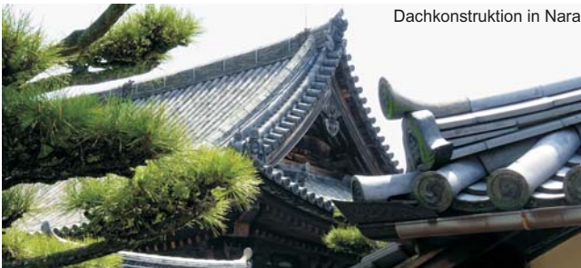
Dachkonstruktion in Nara

Nach der Anmeldung zu dieser Exkursion wird mit der von GEOPULS zugesandten Buchungsbestätigung eine Anzahlung (15 % des Reisepreises) fällig. Die Restzahlung erfolgt zwei Wochen vor Reisebeginn. Es gelten die Geschäftsbedingungen des Veranstalters: Geopuls GbR, Neckarhalde 62, 72108 Rottenburg (Tel. 07472-9808802). Bitte beachten Sie vor Reisebuchung unsere Allgemeinen Reisebedingungen sowie das Formblatt zur Unterrichtung des Reisenden bei einer Pauschalreise nach § 651a des BGB (EU-Richtlinie 2015/2302). Beides schicken wir vor Buchung gerne zu, oder kann auf/von der Webseite www.geopuls.de eingesehen und ausgedruckt werden.