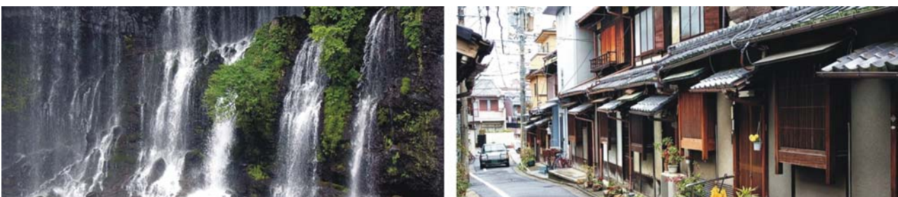
Shiraito-Wasserfall im Südwesten des Fuji-San, Wohnstraße mit älterer Bausubstanz in Kyōto

Der heutige Tag ist vollständig dem Fuji-San und seinem Umland gewidmet. Vom Fujisan Hongū Sengen Taisha, dem Hauptschrein der insgesamt rund 1.300 Sengen-Schreine, vom nahe beim Schrein gelegenen kleinen Wakutama-See (im nördlichen Teil der Stadt Fuji) und vom Shiraito-Wasserfall, von dem aus wir einen kleinen Spaziergang zum Otodome-Wasserfall unternehmen, sowie von einem der fünf Seen im Norden des majestätischen Vulkankegels, werden wir immer wieder herrliche Ausblicke auf den mächtigen Fuji-San genießen.