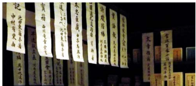
romantische Takachiho-Schlucht mit Basaltsäulen und Wasserfall, traditionelle japanische Schriftrollen