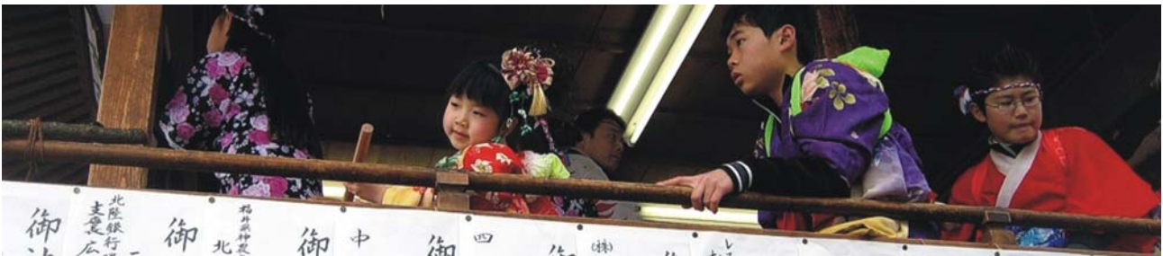
Kinder in traditioneller Festkleidung

Minamata: die Kleinstadt mit knapp 25.000 Einw. im Süden von Kumamoto wurde zum Inbegriff für Umweltschäden durch unkontrollierte Verklappung von Abfällen in der Yatsushiro-See. In den 1950er Jahren litten rund 10.000 Menschen an massiven Schäden des zentralen Nervensystems, ca. 3.000 mit Todesfolge, die auf Quecksilbervergiftung durch die Abwässer eines Chemiewerks der Firma Chisso zurückgeführt werden konnten (Minamata-Krankheit).