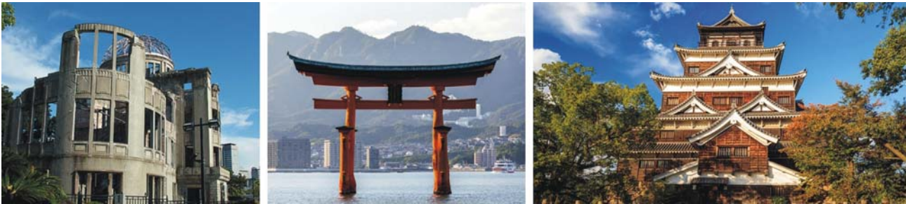
Atombombendom in Hiroshima, Torii vor dem Itsukushima-Schrein auf der kleinen Insel Miyajima, Burg aus dem 16. Jh. in Hiroshima

(2 Übernachtungen in Miyajima-guchi, westlich von Hiroshima)