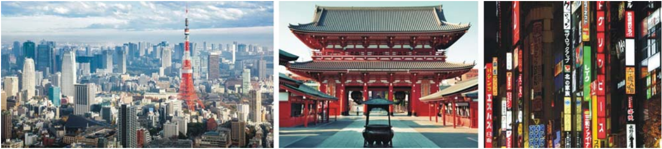
Tōkyō mit Tōkyō-Tower, Asakusa, Leuchtreklame in Shinjuku