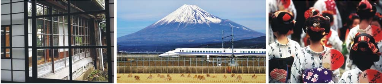
traditioneller Hausbau auf der Halbinsel Izu, Fuji San mit Hochgeschwindigkeitszug, Frauen im Yukata, dem Sommer-Kimono