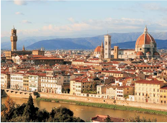
Blick über die Altstadt von Florenz vom Piazzale Michelangelo aus