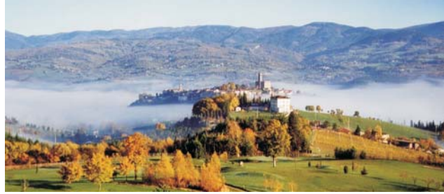
Poppi im Casentino gilt als eines der schönsten Dörfer Italiens