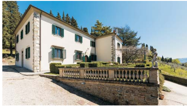
Unsere Unterkunft in den Hügeln östlich von Florenz ist diese schöne Landvilla. Im Speiseraum der Villa (unten) lassen wir uns jeden Abend von Signora Serena mit bester toskanischer Küche verwöhnen.

dieser Folder wurde CO 2 -neutral hergestellt