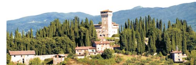
Castello del Trebbio, Ziel der landschaftskundlichen Wanderung am 4. Tag