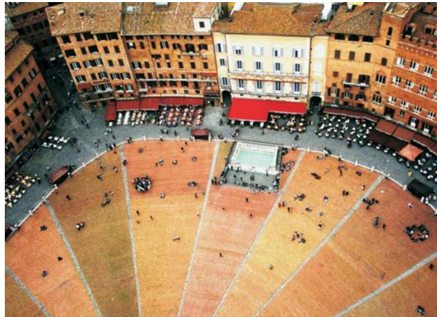
die Piazza del Campo in Siena gilt als einer der schönsten Plätze der Welt