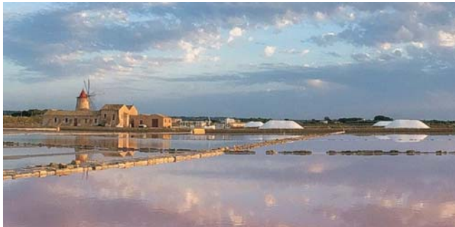
Saline in der Laguna dello Stagnone bei Marsala

Nach der Anmeldung zu dieser Exkursion wird mit der von GEOPULS zugesandten Buchungsbestätigung eine Anzahlung (15 % des Reisepreises) fällig. Die Restzahlung erfolgt zwei Wochen vor Reisebeginn. Es gelten die Geschäftsbedingungen des Veranstalters: Geopuls GbR, Neckarhalde 62, 72108 Rottenburg (Tel. 07472-9808802). Bitte beachten Sie vor Reisebuchung unsere Allgemeinen Reisebedingungen sowie das Formblatt zur Unterrichtung des Reisenden bei einer Pauschalreise nach § 651a des BGB (EU-Richtlinie 2015/2302). Beides schicken wir vor Buchung gerne zu, oder kann auf/von der Webseite www.geopuls.de eingesehen und ausgedruckt werden.