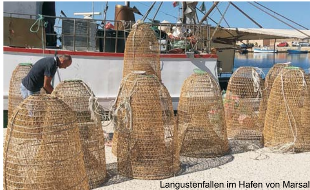
Langustenfallen im Hafen von Marsala

Nur die Eiligen wollen glauben, man könne die Höhepunkte Siziliens in ein paar Tagen kennenlernen. Es ist unmöglich! Wir haben deshalb bei der Ausarbeitung unserer Exkursion Sicilia terra mia , von Anfang an, an einen zweiten Teil gedacht. Hier kommt sie nun, die von vielen unserer Sizilien Gäste lang erwartete Fortsetzung. Es folgt der Südosten mit den Monti Iblei und seinen vorgelagerten Küstenlandschaften. Wir befinden uns dort geologisch, ganz ähnlich wie in Apulien, auf der ungefalteten afrikanischen Kontinentalplatte, was im Gegensatz zum restlichen Sizilien ganz eigene Landschaftsformen hervorgebracht hat. In diesem ersten Teil steht das Welterbe Pantalica mit seinen tausenden Felsengräbern in einer dramatisch schönen Landschaft und einige der ebenfalls zum Welterbe gehörenden Spätbarocken Städte Siziliens auf dem Programm: Noto, Ragusa, Modica aber auch das kaum bekannte Palazzolo Acreide mit den Ruinen des griechischen Akrai. Gerade die Orte im Hinterland sind oft wegen ihrer abseitigen Lage vom Massentourismus verschonte Perlen, die sich teils grandios an die tiefen Schluchten der Monti Iblei anschmiegen. Von den Landschaftsbildern