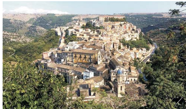
Altstadt von Ragusa

dieser Folder wurde CO 2 -neutral hergestellt