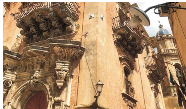
in den Gassen von Ragusa Ibla

GEOPULS als Veranstalter für alle am Reisen interessierten Menschen wurde 2004 von Dozenten des Geographischen Instituts in Tübingen gegründet und arbeitet seitdem mit der vhs zusammen. Begeisterte Geographen und Landeskundler, die Natur, Kultur und Hintergründe eines Ziellandes bestens vermitteln können, führen Sie bei diesen Exkursionen. Wir versuchen dabei, ein Land möglichst umfassend zu bereisen, was bedeutet, dass neben den berühmten Sehenswürdigkeiten auch die Landesnatur Beachtung und Erklärung findet. Kleine Wanderungen und Spaziergänge in die Natur bieten deshalb immer wieder eine schöne und interessante Abwechslung zum Kulturprogramm. Nicht zuletzt gilt es, ein Land so authentisch wie möglich zu erfahren und dabei auch die oft übersehenen kleinen Dinge zu entdecken. Dies funktioniert am besten in einer überschaubaren Gruppe, weshalb die Teilnehmerzahl auf 16 Personen begrenzt ist.