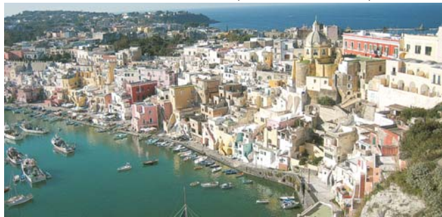
Marina di Corricella auf dem Inselchen Procida im Golf von Neapel

GEOPULS als Spezialreiseveranstalter wurde 2004 von Dozenten des Geographischen Instituts der Uni Tübingen gegründet. Begeisterte Geographen und Landeskundler, die Natur, Kultur und Hintergründe eines Ziellandes bestens kennen, führen Sie bei diesen Reisen. Ein Land wird dabei geographisch möglichst umfassend bereist. Das bedeutet, dass neben den berühmten Sehenswürdigkeiten auch die Landesnatur mit seiner Vegetation, Landschaftsformen, etc. Beachtung und Erläuterung finden. Kleine Wanderungen und Spaziergänge in die Natur bieten deshalb immer wieder eine willkommene Abwechslung zum kulturellen Besichtigungsprogramm. Nicht zu letzt gilt es auch, ein Land so authentisch wie möglich zu erfahren. Dies funktioniert am besten in einer noch überschaubaren Gruppengröße, weshalb die max. Teilnehmerzahl je nach Reise auf 11-16 Personen begrenzt ist.