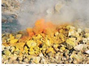
Fumarole im Solfatara-Krater