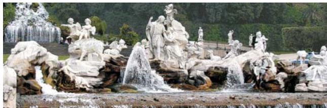
Venus & Adonis Brunnen im Schloßpark der Reggia von Caserta

GEOPULS als Spezialreiseveranstalter wurde 2004 von Dozenten des Geographischen Instituts der Uni Tübingen gegründet. Begeisterte Geographen und Landeskundler, die Natur, Kultur und Hintergründe eines Ziellandes bestens kennen, führen Sie bei diesen Reisen. Ein Land wird dabei geographisch möglichst umfassend bereist. Das bedeutet, dass neben den berühmten Sehenswürdigkeiten auch die Landesnatur mit seiner Vegetation, Landschaftsformen, etc. Beachtung und Erläuterung finden. Kleine Wanderungen und Spaziergänge in die Natur bieten deshalb immer wieder eine willkommene Abwechslung zum kulturellen Besichtigungsprogramm. Nicht zu letzt gilt es auch, ein Land so authentisch wie möglich zu erfahren. Dies funktioniert am besten in einer noch überschaubaren Gruppengröße, weshalb die max. Teilnehmerzahl je nach Reise auf 11-16 Personen begrenzt ist.