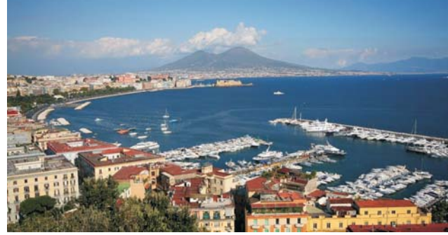
Blick vom Stadtviertel Posillipo Richtung Vesuv

Zentral, in einem der schönsten Stadtviertel Neapels um die Fußgängerzone der Piazza dei Martiri, nehmen wir Quartier in einem kleinen Hotel, das ausschließlich für unsere Gruppe von max. 16 Personen reserviert ist. Auch für eigene Entdeckungen, Bummeln, Einkaufen ist dies eine perfekte Ausgangslage. Von dort aus geht es einmal zu den Sehenswürdigkeiten der Stadt, ein andermal mit unserem Exkursionsbus zu Ausflügen in die Umgebung Neapels.