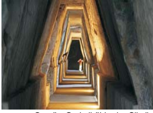
Cumä - Orakelhöhle der Sibylle