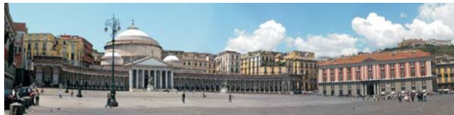
Neapel - Piazza Plebiscito (auch Titelbild)

dieser Folder wurde CO 2 -neutral hergestellt