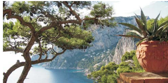
Blick von Tragara entlang der Südküste Capris

Hinweis zu den Wanderungen: normale körperliche Fitness ist vollkommen ausreichend, Sie sollten keine Schwierigkeiten beim Gehen oder bei einigen unvermeidbaren Steigungen haben.