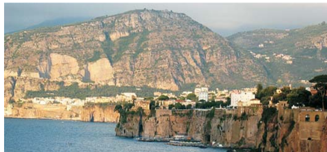
Blick auf die Tuffterrasse von Sorrent bei der Überfahrt von Capri aus.

GEOPULS als Veranstalter für alle am Reisen interessierten Menschen wurde 2004 von Dozenten des Geographischen Instituts in Tübingen gegründet. Begeisterte Geographen und Landeskundler, die Natur, Kultur und Hintergründe eines Ziellandes bestens vermitteln können, führen Sie bei diesen Exkursionen. Wir versuchen dabei, ein Land möglichst umfassend zu bereisen, was bedeutet, dass neben den berühmten Sehenswürdigkeiten auch die Landesnatur Beachtung und Erklärung findet. Kleine Wanderungen und Spaziergänge in die Natur bieten deshalb immer wieder eine schöne und interessante Abwechslung zum Kulturprogramm. Nicht zuletzt gilt es, ein Land so authentisch wie möglich zu erfahren und dabei auch die oft übersehenen kleinen Dinge zu entdecken. Dies funktioniert am besten in einer überschaubaren Gruppe, weshalb die Teilnehmerzahl bei dieser Reise auf 15 Personen begrenzt ist.