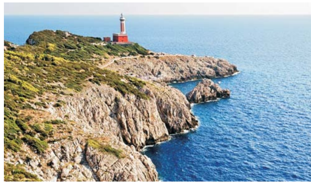
Leuchtturm von Punta Carena an Capris wilder Westküste.

dieser Folder wurde CO 2 -neutral hergestellt