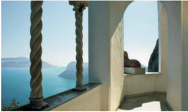
Blick von Axel Munthes Villa S. Michele bei Anacapri zur Halbinsel von Sorrent