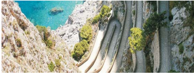
Die Via Krupp, erbaut von Stahlbaron F. A. Krupp im Jahr 1902 windet sich in einmaliger Weise von Capri-Ort hinunter zur Marina Piccola

Nach der Anmeldung zu dieser Exkursion wird mit der von GEOPULS zugesandten Buchungsbestätigung eine Anzahlung (15 % des Reisepreises) fällig. Die Restzahlung erfolgt zwei Wochen vor Reisebeginn. Es gelten die Geschäftsbedingungen des Veranstalters: Geopuls GbR, Neckarhalde 62, 72108 Rottenburg (Tel. 07472-9808802). Bitte beachten Sie vor Reisebuchung unsere Allgemeinen Reisebedingungen sowie das Formblatt zur Unterrichtung des Reisenden bei einer Pauschalreise nach § 651a des BGB (EU-Richtlinie 2015/2302). Beides schicken wir vor Buchung gerne zu, oder kann auf/von der Webseite www.geopuls.de eingesehen und ausgedruckt werden.