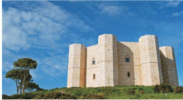
Wahrzeichen Apuliens: Castel del Monte Kaiser Friedrich II von Hohenstaufen