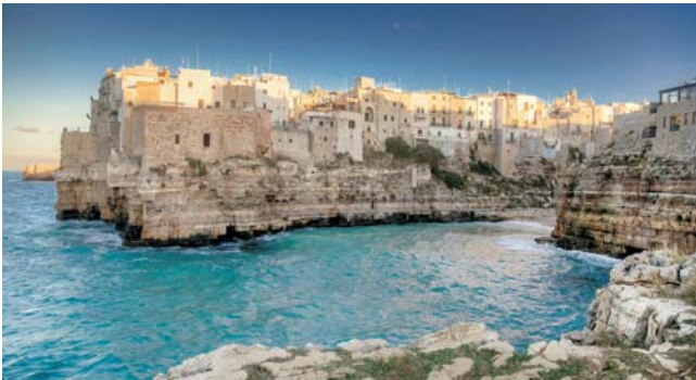
Polignano a Mare

Nach der Anmeldung zu dieser Exkursion wird mit der von GEOPULS zugesandten Buchungsbestätigung eine Anzahlung (15% des Reisepreises) fällig. Die Restzahlung erfolgt zwei Wochen vor Reisebeginn. Es gelten die Geschäftsbedingungen des Veranstalters: Geopuls GbR, Neckarhalde 62, 72108 Rottenburg (Tel. 07472-9808802). Bitte beachten Sie vor Reisebuchung unsere Allgemeinen Reisebedingungen sowie das Formblatt zur Unterrichtung des Reisenden bei einer Pauschalreise nach § 651a des BGB (EU-Richtlinie 2015/2302). Beides schicken wir vor Buchung gerne zu, oder kann auf/von der Webseite www.geopuls.de eingesehen und ausgedruckt werden.