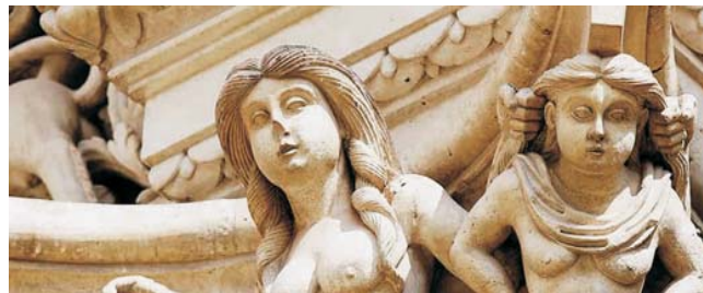
Fassadendetail in der Barockstadt Lecce

GEOPULS als Veranstalter für alle, am wirklichen Reisen interessierten Menschen, wurde 2004 von ehemaligen Dozenten des Geographischen Instituts in Tübingen, gegründet. Geopuls arbeitet seitdem ausschließlich mit der vhs zusammen. Begeisterte Geographen und Landeskundler, die Natur, Kultur und Hintergründe eines Ziellandes bestens vermitteln können, führen Sie bei diesen Exkursionen. Wir versuchen dabei, ein Land möglichst umfassend zu bereisen, was bedeutet, dass neben den berühmten Sehenswürdigkeiten auch die Landesnatur Beachtung und Erklärung findet. Kleine Wanderungen und Spaziergänge in die Natur bieten deshalb immer wieder eine schöne und interessante Abwechslung zum Kulturprogramm. Nicht zuletzt gilt es, ein Land so authentisch wie möglich zu erfahren und dabei auch die oft übersehenen kleinen Dinge zu entdecken. Dies geht am besten in einer kleineren Gruppe, weshalb die Teilnehmerzahl begrenzt ist.