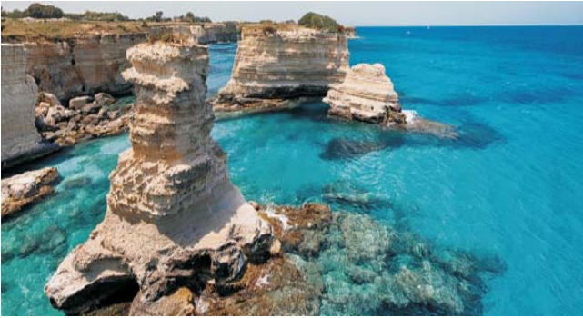
Erosions-Kliff-Küste bei Torre Sant'Andrea im Salento