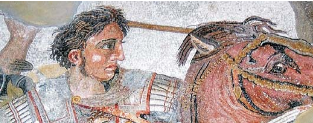
Detail aus dem Alexandermosaik im archäolog. Nationalmuseum zu Neapel

Nach Anmeldung zu dieser Reise wird mit der von GEOPULS zugesandten Buchungsbestätigung eine Anzahlung (15% des Reisepreises) fällig. Die Restzahlung erfolgt zwei Wochen vor Reisebeginn. Es gelten die Geschäftsbedingungen des Veranstalters: Geopuls GbR, Neckarhalde 62, 72108 Rottenburg (Tel. 07472-9808802). Bitte beachten Sie vor Buchung unsere AGB sowie das Formblatt zur Unterrichtung des Reisenden bei einer Pauschalreise nach § 651a BGB (EU-Richtlinie 2015/2302). Beides schicken wir gerne vor Buchung zu oder kann auf der Geopuls-Homepage aufgerufen werden. www.geopuls.de