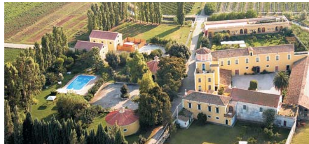
Unsere Agriturismo-Unterkunft nahe des Cilento ist dieses historische Landgut