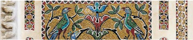
Detail eines mittelalterlichen Goldmosaiks im Dom von Ravello

Nach der Anmeldung zu dieser Reise wird mit der von GEOPULS zugesandten Buchungsbestätigung eine Anzahlung (15 % des Reisepreises) fällig. Die Restzahlung erfolgt zwei Wochen vor Reisebeginn. Es gelten die Geschäftsbedingungen des Veranstalters: Geopuls GbR, Neckarhalde 62, 72108 Rottenburg (Tel. 07472-9808802). Bitte beachten Sie vor Reisebuchung unsere Allgemeinen Reisebedingungen sowie das Formblatt zur Unterrichtung des Reisenden bei einer Pauschalreise nach § 651a des BGB (EU-Richtlinie 2015/2302). Beides schicken wir gerne vor Buchung zu oder kann auf/von der Geopuls-Homepage eingesehen oder ausgedruckt werden. www.geopuls.de