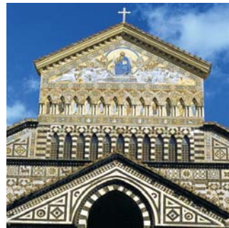
Amalfi, Detail Domfassade

dieser Folder wurde CO 2 - neutral hergestellt