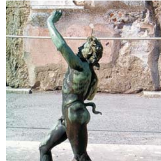
Pompeji, Tanzender Faun

GEOPULS als Veranstalter für alle am Reisen interessierten Menschen wurde 2004 von Dozenten des Geographischen Instituts in Tübingen gegründet. Begeisterte Geographen und Landeskundler, die Natur, Kultur und Hintergründe eines Zielandes bestens vermitteln können, führen Sie bei diesen Exkursionen. Wir versuchen dabei, ein Land möglichst umfassend zu bereisen, was bedeutet, dass neben den berühmten Sehenswürdigkeiten auch die Landesnatur Beachtung und Erklärung findet. Kleine Wanderungen und Spaziergänge in die Natur bieten deshalb immer wieder eine schöne und interessante Abwechslung zum Kulturprogramm. Nicht zuletzt gilt es, ein Land so authentisch wie möglich zu erfahren und dabei auch die oft übersehenen kleinen Dinge zu entdecken. Dies funktioniert am besten in einer überschaubaren Gruppe, weshalb die Teilnehmerzahl bei dieser Reise auf 14 Personen begrenzt ist.