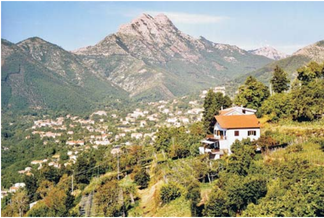
Unsere Unterkunft im Hinterland von Amalfi: ein von Reben und Edelkastanien umgebener Agriturismo mit herrlicher Aussicht auf Berge und Meer