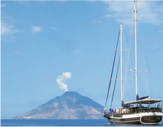
unsere Motorsegelyacht vor Stromboli. Mehr Bilder zur Yacht auf: www.geopuls.de/studienreisen/italien-8/aeolische-inseln/allgemeines