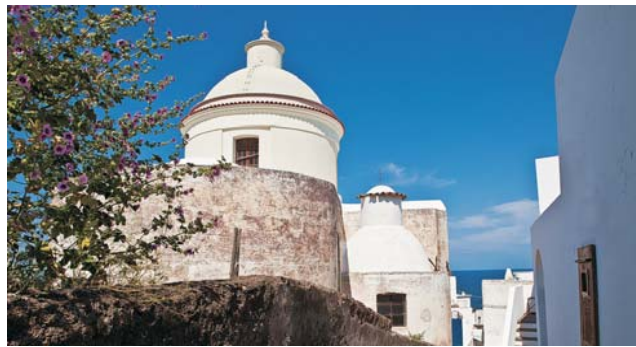
Stromboli: San Vincenzo (oben) und unsere Motorsegelyacht (unten)

dieser Folder wurde CO 2 -neutral hergestellt