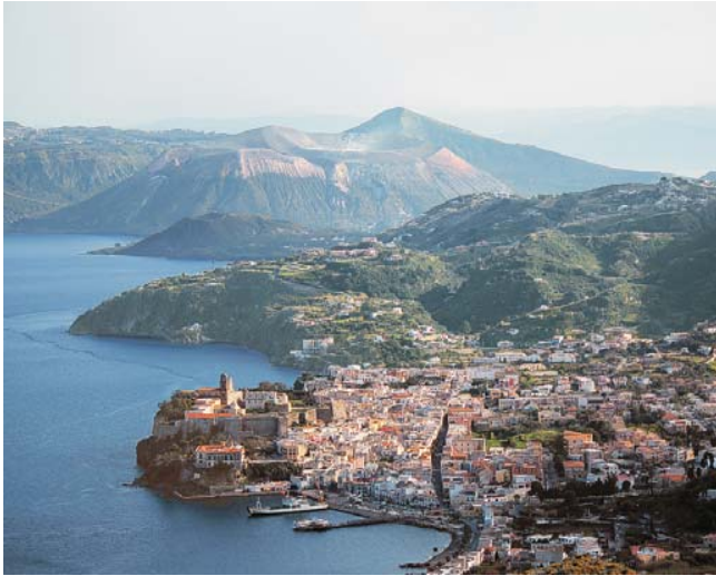
Blick vom Monterosa über Lipari nach Vulcano mit dem Gran Cratere