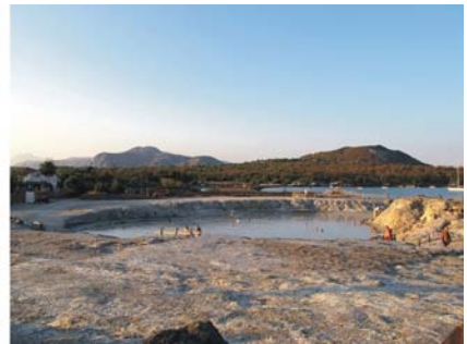
Bilder v.l.: unsere Yacht am Anleger auf der Insel Vulcano, das 35° C warme Natur-Schlammbad in der Thermalzone Vulcanos