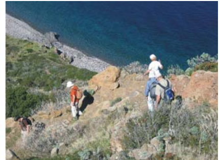
Bilder v.l.: Eindrücke vom Wanderweg auf Filicudi – Macchia, Einblick in den vulkanischen Bau der Insel, Wanderpfad