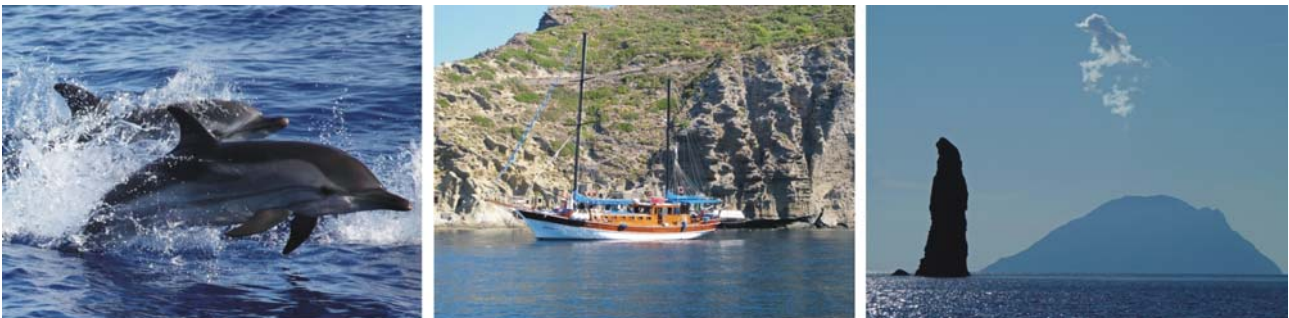
Bilder v.l.: Mittelmeer-Delfine, unsere Yacht im Krater von Pollara, der 70 m hohe La Canna Felsen zwischen Filicudi und Alicudi