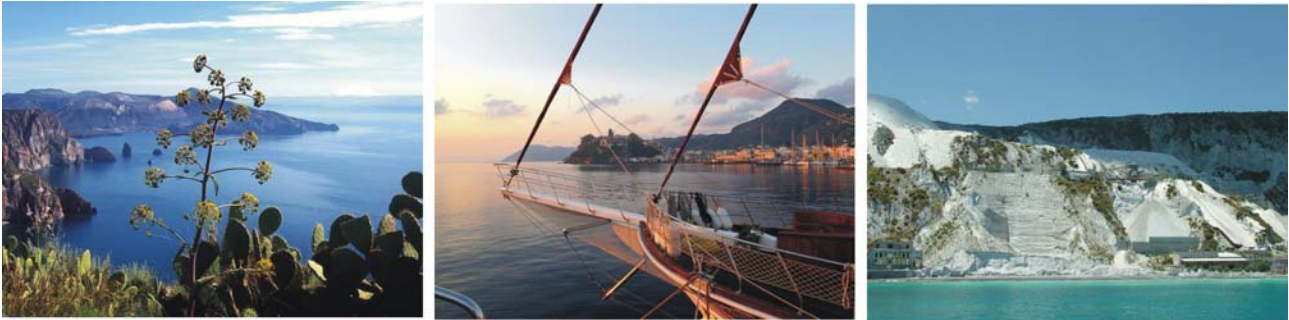
Bilder v.l.: Belvedere del Quattrocchi, Bug unserer Yacht am Anleger in der Bucht von Lipari, ehemaliger Bimsabbau

Nach dem Frühstück holt uns ein Kleinbus am Landungssteg zu einer Inselrundfahrt ab, wo wir einige der schönsten und interessantesten Stellen Liparis kennenlernen werden. Zunächst geht es vom Hafen aus auf einer schönen Strecke hinauf auf die Hochfläche mit vielfältigen Einblicken in die Siedlungs- und Agrarstruktur der Insel. Beim 214 m über dem Meer gelegenen Belvedere del Quattrocchi genießen wir eine grandiose Aussicht auf den Südtteil Liparis bis hinüber nach Vulcano. Anschließend durchqueren wir die landwirtschaftlich geprägte Hochfläche der Insel mit ihren Streusiedlungen bis zur steilen Nordküste, wo unser Weg über Serpentinaen, immer bei schönster Aussicht auf die Insel Salina, zur Ortschaft Aquacalda führt. Danach geht die Fahrt durch das Bimssteingebiet im Nordosten Liparis. Besonders bizarr treten uns an manchen Stellen die Industrie-Ruinen des seit einigen Jahren stillgelegten Bimssteinabbaus gegenüber. Im Zuge der Anerkennung als UNESCO-Weltnaturerbe mußte der, ohnehin im Sterben liegende, Bimssteinabbau vollends eingestellt werden.