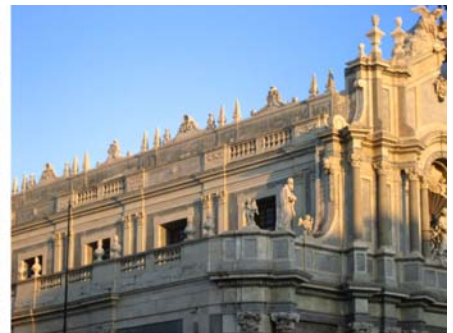
Catania: Elefantenbrunnen auf der Piazza Duomo, Fischmarkt, Ausschnitt Domfassade