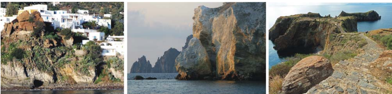
Bilder v.l.: weiße Würfelhäuser auf Panarea, Die Felsen von Lisca Bianca, Punta Milazzese mit bronzezeitlichen Besiedlungsspuren

Nach dem gemütlichen Frühstück auf dem Achterdeck machen wir uns auf zu einer kleinen Wanderung durch die wunderschönen Gässchen mit Kubushäusern, Villen und dem Blütenmeer der flankierenden Gärten bis zur herrlichen Bucht der Cala Jungo (Wegstrecke Hin- und Zurück insgesamt ca. 6 km). Es gibt vieles zu sehen! Unser Vormittagsziel aber ist vor allem die über der Cala Jungo auf einer fossilen Strandterrasse ausgegrabene bronzezeitliche Siedlung der Punta Milazzese, die wir besichtigen werden. Zurück an Bord geht die Fahrt zu den an der Ostküste vor Panarea gelegenen Felsklippen (Dattilo, Lisca Nera, Bottaro, Lisca Bianca), letzte Bruchstücke des in der erdgeschichtlichen Vergangenheit viel größeren Panareas. Panarea ist die älteste der Äolischen Inseln, deren Entstehungszeit mindestens 700.000 Jahre zurückliegt. Die genannten Felsklippen gelten als Reste einer früheren Kraterstruktur. Das besondere dort ist die Vielzahl untermeerischer Fumarolen die man vom Boot aus hervorragend beobachten und in deren aufquellenden Blasen man sogar schwimmen kann. Gut