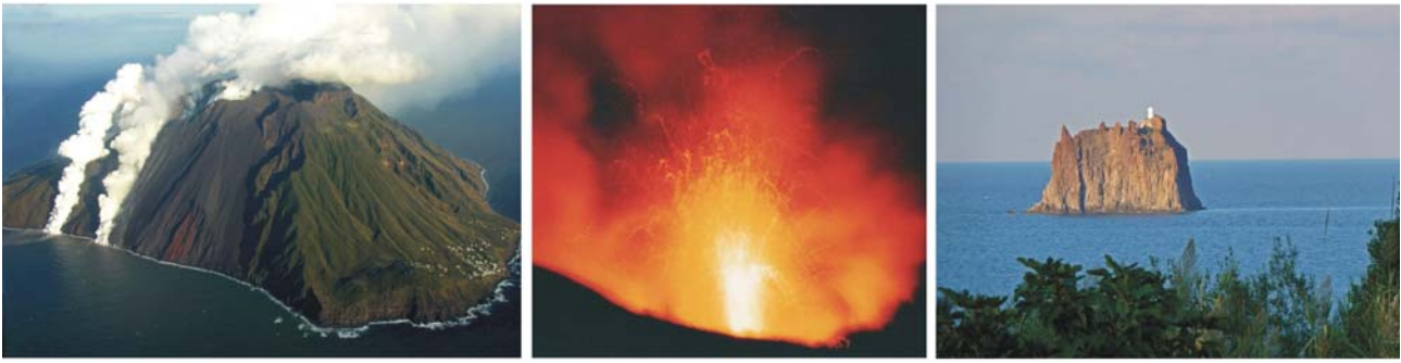
Bilder v.l.: Nordwestseite des Stromboli mit der Sciara del fuoco, nächtlicher Feuerschein, Strombolicchio gesehen von San Bartolo.