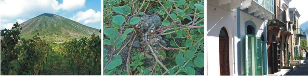
Bilder v.l.: Malvasia Anbau zu Füßen des Monte dei Porri, Kapernpflanze in Kultur, Sträßchen im malerischen Santa Marina Salina

„Panaria, obwohl die kleinste, ist entschieden die anmuthigste unter den Liparischen Inseln, ein wirklich idyllischer Erdenwinkel. Überall sind schöne Vordergründe, überall die kleinen Häuser mit den weißgetünchten Säulen und den schönen Reben-Prieguli, neben welchen entweder ein üppiger Feigenbaum oder ein Johannisbrotbaum steht, und aus denen man die weite Aussicht auf das Meer genießt.“ Erzherzog Ludwig Salvator „Die Liparischen Inseln“ 1895.