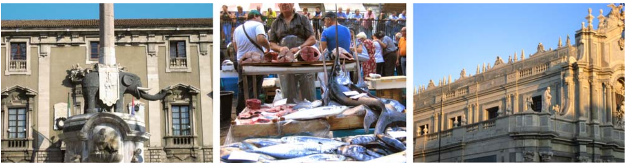
Catania: Elefantenbrunnen auf der Piazza Duomo, Fischmarkt, Ausschnitt Domfassade

Nach dem Frühstück verlassen wir unsere Yacht und blicken hoffentlich auf eine Woche mit bestem Wetter und schönen Eindrücken zurück. In Lipari besteigen wir morgens das Tragflügelboot und fahren zurück nach Milazzo, wo unser Exkursionsbus bereits auf uns wartet. Von Milazzo geht es zurück nach Catania, wo wir am Nachmittag ankommen und unsere Unterkunft inmitten der historischen Altstadt beziehen. Damit wir Catania kennenlernen, unternehmen wir selbstverständlich einen Rundgang zu den wichtigsten Sehenswürdigkeiten im historischen Zentrum. Vielleicht bekommen Sie dabei Appetit, möchten mehr von dieser faszinierenden Stadt sehen und denken dabei schon an die nächste Reise nach Sizilien. Am Sonntag Morgen (09:55-12:15 *) geht es via Direktflug Catania-Stuttgart wieder nach Hause.