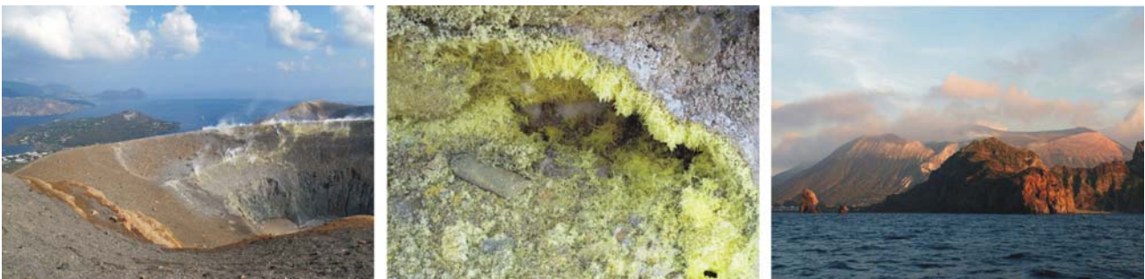
Bilder v.l.: Gran Cratere mit Fumarolendämpfen, Schwefelnadeln als Abscheidungsprodukt, Gran Cratere vom Wasser aus

Nach dem Frühstück Wanderung zum Gran Cratere, dem 391m hohen zentralen Kraterberg Vulcanos (reine Gehzeit, ca. 2 Stunden (hin und zurück auf meist gut zu begehenden Pfaden), Dauer insgesamt ca. 3-4 Stunden). Der Aufstieg bietet schöne Eindrücke von Vegetation, vulkanischem Bau sowie von Siedlungs- und Agrarstruktur der Insellandschaft. Oben am Kraterrand angekommen (340 m) ist man nicht nur von der grandiosen Aussicht Richtung Norden auf das gesamte Archipel überwältigt, sondern auch vom Prototyp eines Explosionskraters in reinster Form. Ganz besonders faszinierend ist die aktive Fumarolentätigkeit am Kraterrand mit vielfältigen Abscheidungsprodukten wie goldgelb glänzenden Schwefelnadeln oder weißglitzernden Borsäurekristallen welche die Austrittslöcher der Fumarolen umgeben. Wer noch Lust und Freude hat, kann am Rand des Kraters bis zu seinem höchsten Punkt (391m) aufsteigen und weitere Einblicke in den älteren und größeren südöstlichen Inselkörper gewinnen. Wichtig für den Aufstieg ist festes Schuhwerk mit Profil. Wer lieber unten bleiben möchte, kann leicht ein Alternativprogramm auf eigene Faust unternehmen.