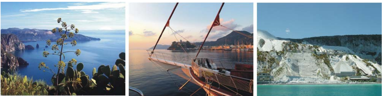
Bilder v.l.: Belvedere del Quattrocchi, Bug unserer Yacht am Anleger in der Bucht von Lipari, ehemaliger Bimsabbau

Nach dem Frühstück holt uns ein Kleinbus am Landungssteg zu einer Inselrundfahrt ab, wo wir einige der schönsten und interessantesten Stellen Liparis kennenlernen werden. Zunächst geht es vom Hafen aus auf einer schönen Strecke hinauf auf die Hochfläche mit vielfältigen Einblicken in die Siedlungs- und Agrarstruktur der Insel. Beim 214 m über dem Meer gelegenen Belvedere del Quattrocchi genießen wir eine grandiose Aussicht auf den Südteil Liparis bis hinüber nach Vulcano. Anschließend durchqueren wir die landwirtschaftlich geprägte Hochfläche der Insel mit ihren Streusiedlungen bis zur steilen Nordküste, wo unser Weg über Serpentine, immer bei schönster Aussicht auf die Insel Salina, zur Ortschaft Aquacalda führt. Danach geht die Fahrt durch das Bimssteingebiet im Nordosten Liparis. Besonders bizarr treten uns an manchen Stellen die Industrie-Ruinen des seit einigen Jahren stillgelegten Bimssteinabbaus gegenüber. Im Zuge der Anerkennung als UNESCO-Weltnaturerbe mußte der, ohnehin im Sterben liegende, Bimssteinabbau vollends eingestellt werden.