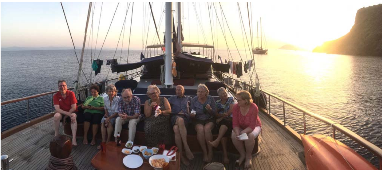
Sundowner auf dem Vorderdeck