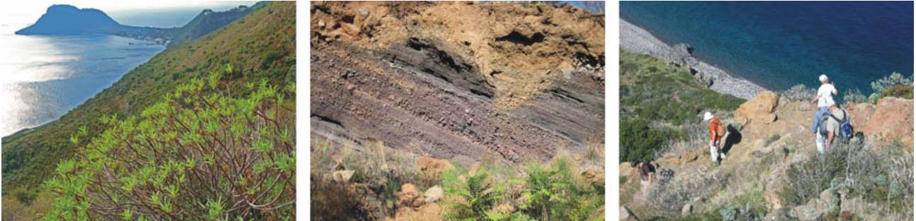
Bilder v.l.: Eindrücke vom Wanderweg auf Filicudi – Macchia, Einblick in den vulkanischen Bau der Insel, Wanderpfad

die Wanderung aber auch schöne und interessante Einblicke in den vulkanischen Bau der Insel sowie wundervolle Ausblicke hin zu allen bisher besuchten Inseln. Ziel der Wanderung ist das verlassene Dorf Zucco Grande, das nur noch einen einzigen ständigen Einwohner hat. Wir werden ihn besuchen. (Wanderung reine Gehzeit insgesamt 3 Stunden hin und zurück, einige Treppen mit kurzen An- und Abstiegen, gutes Schuhwerk ist wichtig. Um die Anstrengung für alle in Grenzen zu halten, lassen wir uns von Pecorini bis Valle Chiesa chauffieren und haben so bereits die Grundhöhe genommen). Wer nicht mitwandern möchte, kann selbstverständlich einen Bade- und / oder Ruhetag einlegen, bzw. kleinere Entdeckungs-Spaziergänge in Pecorini a Mare oder Filicudi Porto unternehmen. Das Mittagessen nehmen wir heute nicht an Bord sondern an einem ganz besonderen Ort ein. Mehr wird nicht verraten. Nachmittags von Filicudi Porto aus Abfahrt nach Lipari. Abschlußabend und letzte Nacht an Bord.