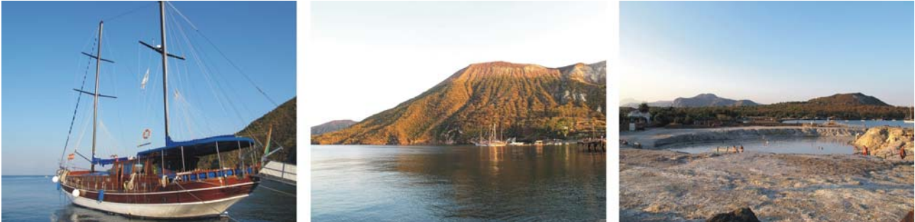
Bilder v.l.: unsere Yacht am Anleger auf der Insel Vulcano, das 35° C warme Natur-Schlammbad in der Thermalzone Vulcanos

Nach dem Erreichen von Milazzo geht es mit dem Tragflügelboot zur ersten Insel: Vulcano. Am späteren Nachmittag Willkommen an Bord, Beziehen der Kajüten und Erklärungen zu unserer Yacht. Danach, wenn die Tagestouristen vom sizilianischen „Festland“ die Insel schon wieder verlassen haben, kleiner Spaziergang an Land zu den nahen postvulkanischen Erscheinungen Vulcanos (heißes Schlammbad, Fumarolen der Strandzone). Vulcano ist neben Stromboli die zweite Insel des Archipels mit aktivem Vulkanismus. Der letzte Ausbruch des Gran Cratere datiert auf das Jahr 1890. Es ist besonders schön und reizvoll die nur einen Steinwurf von unserer Anlegestelle entfernte Zone um den Faraglione di Levante mit seinen postvulkanischen Erscheinungen am späten Nachmittag zu besuchen, wenn die Tagestouristen mit dem letzten Boot die Insel endgültig verlassen. Fast alleine genießt man so ein Bad im warmen Naturschlammbecken und anschließend geht es zur Reinigung nur wenige 10er Meter weiter ins thermalbeheizte Meer mit seinen aufquellenden, blubbernden warmen Quellen.