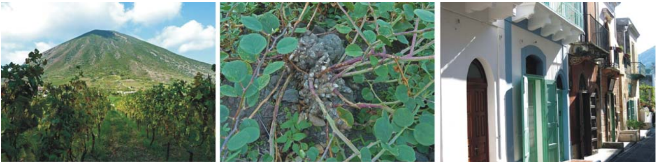
Bilder v.l.: Malvasia Anbau zu Füßen des Monte dei Porri, Kapernpflanze in Kultur, Sträßchen im malerischen Santa Marina Salina

„Panaria, obwohl die kleinste, ist entschieden die anmuthigste unter den Liparischen Inseln, ein wirklich idyllischer Erdenwinkel. Überall sind schöne Vordergründe, überall die kleinen Häuser mit den weißgetünchten Säulen und den schönen Reben-Prieguli, neben welchen entweder ein üppiger Feigenbaum oder ein Johannisbrotbaum steht, und aus denen man die weite Aussicht auf das Meer genießt.“ Erzherzog Ludwig Salvator „Die Liparischen Inseln“ 1895.