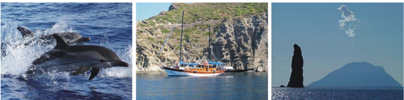
Bilder v.l.: Mittelmeer-Delfine, unsere Yacht im Krater von Pollara, der 70 m hohe La Canna Felsen zwischen Filicudi und Alicudi