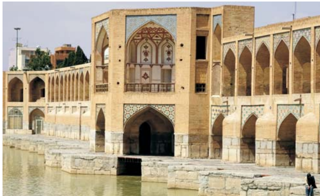
Isfahan - Pol-e Chādschu, Brücke von 1650 über den Zayandeh Rud