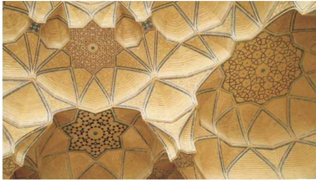
Isfahan - Detail des Südiwan der Jame-Moschee