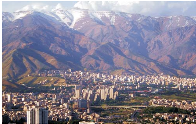
Teheran vor den schneebedeckten Gipfeln des Albus

dieser Folder wurde CO 2 -neutral hergestellt