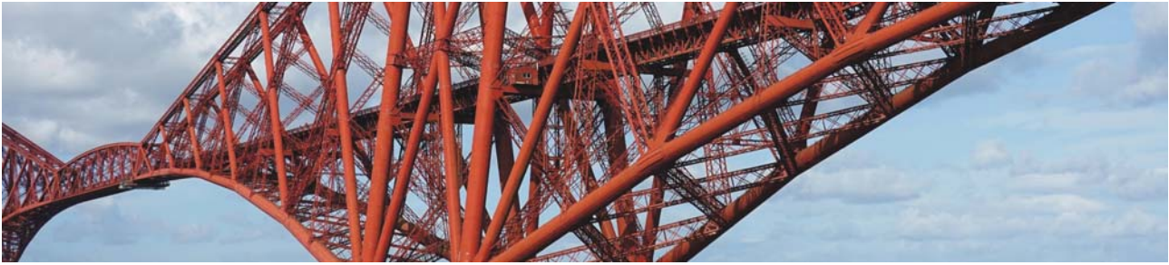
Forth Railway Bridge