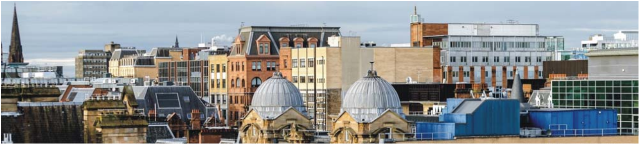
Dächer von Glasgow