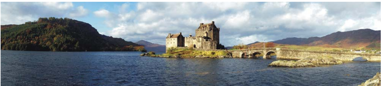
Inbegriff einer schottischen Burg: Eilean Donan Castle

Zum Abschluss der Exkursion steht als ein weiterer Höhepunkt die stolze Hauptstadt Schottlands auf dem Programm: in Edinburgh hat seit 1999 das schottische Parlament (nach dem Referendum von 1998) und die Bank of Scotland seinen Sitz.