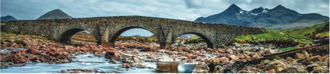
alte Wege im schottischen Hochland