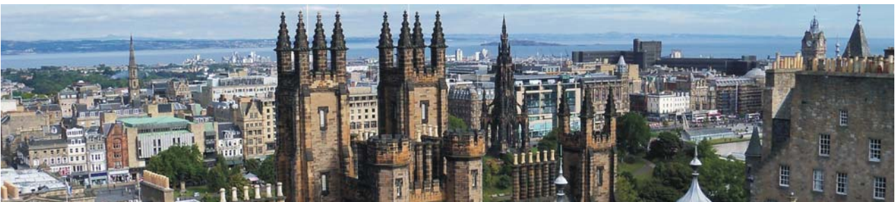
Blick über Edinburgh zum Firth of Forth