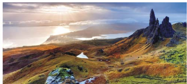
Isle of Skye: wilde Landschaft der Trotternish Peninsula