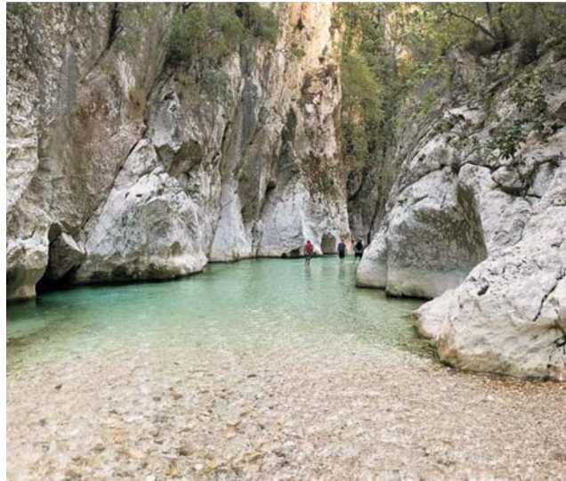
Die klaren Flüsse und Bäche des Epirus bieten immer wieder Gelegenheit zu einem erfrischenden Bad. Hier bei einer kleinen Flußwanderung am Acheron

dieser Folder wurde CO 2 - neutral hergestellt