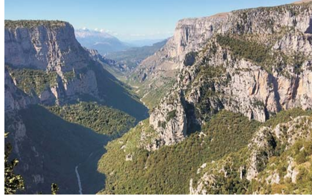
Blick vom Aussichtspunkt Beloi in die hier fast 1000 m tiefe Vikos-Schlucht

Wer gerne in mediterraner Natur wandert und gleichzeitig ein ansprechendes Kulturprogramm genießen möchte, für den ist diese Exkursion genau richtig. Die FAZ beschrieb vor einigen Jahren unser Exkursionsgebiet im Epirus, die Zagorachoria, nicht weit von der albanischen Grenze, als das „bestgehütete Geheimnis Griechenlands“. Und in der Tat, es handelt sich um die am dünnsten besiedelte Region ganz Griechenlands in einer geradezu arkadisch schönen Landschaft. Unterkunft nehmen wir ganz authentisch in einem der steinernen Bergdörfer in ca. 1100 m Höhe. In dieser ursprünglichen Umgebung essen und trinken wir was die herrliche Landschaft hergibt. Ein kulinarischer Genuß!