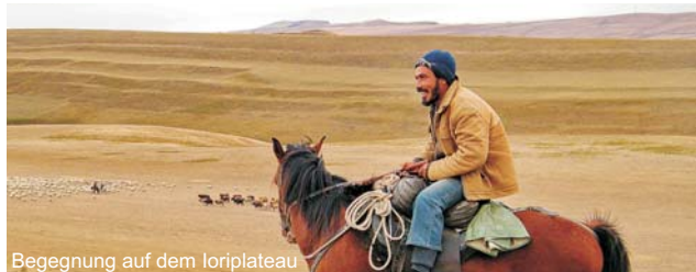
Begegnung auf dem Ioriplateau

GEOPULS als Reiseveranstalter wurde 2004 von Dozenten des Geographischen Instituts in Tübingen gegründet und arbeitet seitdem mit ausgewählten Volkshochschulen zusammen. Begeisterte Geographen, die ein Land durch Ihre eigene Arbeit während vieler Aufenthalte von allen Seiten kennen gelernt haben, führen Sie durch Kultur- und Natur des jeweiligen Reisezieles. Bei einer Reise mit Geographen gibt es neben den touristischen Höhepunkten aber immer noch etwas mehr zu sehen und zu erleben. Wenig Bekanntes, tiefe Einblicke, das Erkennen von Zusammenhängen in Kultur- und Naturraum, Hintergründiges. Ausflüge in die Natur mit der einen oder anderen kleinen Wanderung gehören immer mit dazu, um die landschaftlichen Besonderheiten und Schönheit kennenzulernen und zu genießen. Die Teilnehmerzahl ist auf 16 Personen beschränkt, was ein Reisen abseits massentouristischer Strukturen erst ermöglicht.