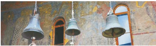
Szenerie in der mittelalterlichen Höhlenstadt Vardzia (UNESCO-Welterbe)