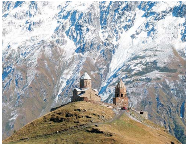
Gergeti-Dreifaltigkeitskirche vor der Kulisse des Kazbeg Vulkans (5047m)

dieser Folder wurde CO 2 - neutral hergestellt