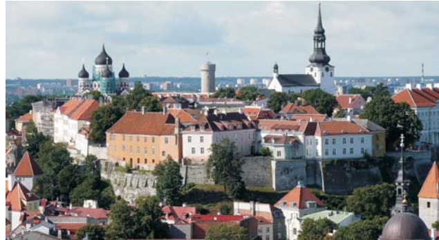
Estland: Oberstadt mit Alexander-Newski-Kathedrale in Tallinn