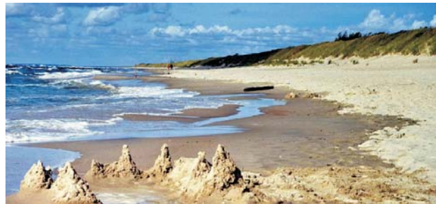
Ostseestrand in Litauen

GEOPULS als Reiseveranstalter wurde 2004 von Dozenten des Geographischen Instituts in Tübingen gegründet und arbeitet seitdem mit ausgewählten Volkshochschulen zusammen. Begeisterte Geographen, die ein Land durch Ihre Arbeit während vieler Aufenthalte von allen Seiten kennen gelernt haben, führen Sie durch Kultur und Natur des jeweiligen Reisezieles. Bei einer Reise mit Geographen gibt es, neben den touristischen Höhepunkten, immer noch etwas mehr zu sehen und zu erleben. Wenig Bekanntes, tiefe Einblicke, das Erkennen von Zusammenhängen in Kultur- und Naturraum, Hintergründiges. Ausflüge in die Natur mit der einen oder anderen kleinen Wanderung gehören dazu, um auch die landschaftlichen Besonderheiten und deren Schönheit kennenzulernen und zu genießen. Die Teilnehmerzahl ist je nach Reise auf angenehme 12 bis max. 16 Personen beschränkt, was auch noch ein Reisen abseits massentouristischer Strukturen ermöglicht.