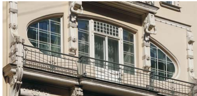
Jugendstil in Riga/Lettland: Treppenhaus und Fenster