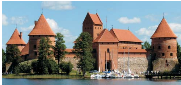
Trakai: bis 1323 Hauptstadt von Litauen

dieser Folder wurde CO 2 -neutral hergestellt