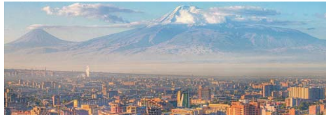
oben: Blick über Eriwan mit Ararat

GEOPULS als Reiseveranstalter wurde 2004 von Dozenten des Geographischen Instituts in Tübingen gegründet. Durch die Zusammenarbeit mit der VHS bietet sich Ihnen die Gelegenheit, mit uns ein Land intensiv, möglichst authentisch und geographisch ganzheitlich zu erleben. Nicht Reiseleiter von Beruf, sondern begeisterte Geographen und Landeskundler, die sich durch eigene Arbeiten und Erfahrungen im jeweiligen Land bestens auskennen, bilden die Mannschaft von Geopuls. Das Kennenlernen von Kultur und Menschen ist nur die eine Hälfte einer Reise mit Geopuls. Ebensoviele Aufmerksamkeit schenken wir stets der Landesnatur. Ausflüge und Spaziergänge in die Natur gehören deshalb zu jeder Reise dazu, um die Besonderheiten von Landschaft, Vegetation, Klima, usw. verstehen und hautnah erleben zu können. Die Gruppengröße ist bewusst stets überschaubar.