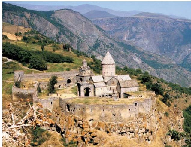
das im Jahr 895 gegründete Kloster Tatew im Süden Armeniens