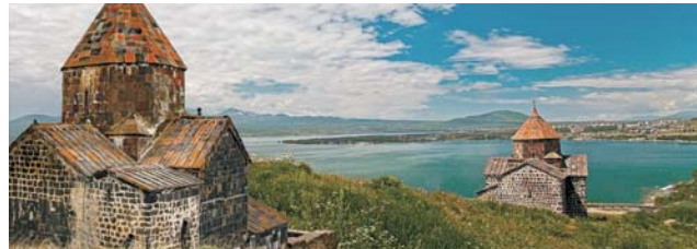
unten: am Sewan-See