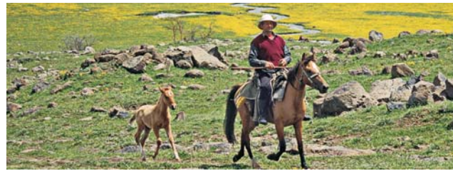
Begegnung in der Hochlandsteppe bei Antarat

dieser Folder wurde CO 2 -neutral hergestellt