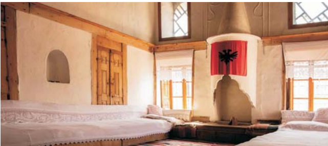
Wohnraum in einem traditionellen Bürgerhaus in Gjirokastra

* Aufpreis zum Flug im Mai: 140,- € (Hauptsaison) max. Teilnehmerzahl: 16 Personen