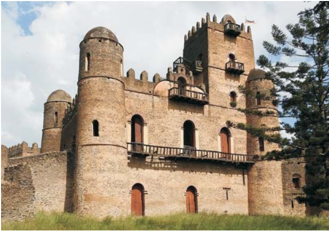
Palast des Fasildas in Gondar