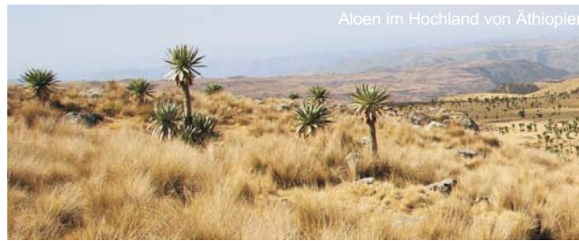
Aloes im Hochland von Äthiopien

dieser Folder wurde CO 2 -neutral hergestellt