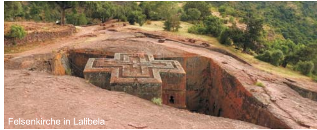
Felsenkirche in Lalibela

GEOPULS wurde 2004 von Dozenten des Geographischen Instituts in Tübingen gegründet und arbeitet seitdem mit ausgewählten Volkshochschulen zusammen. Begeisterte Geographen, die ein Land durch Ihre Arbeit von allen Seiten kennengelernt haben, führen Sie durch Kultur und Natur des Reiseziels, wobei es, neben den touristischen Höhepunkten, immer noch etwas mehr zu sehen und zu erleben gibt. Wenig Bekanntes, tiefe Einblicke, das Erkennen von Zusammenhängen in Kultur- und Naturraum, Hintergründiges. Ausflüge in die Natur mit der einen oder anderen kleinen Wanderung gehören dazu, um auch die landschaftlichen Besonderheiten und deren Schönheit kennenzulernen und zu genießen. Die Teilnehmerzahl ist je nach Reise auf angenehme 12 bis max. 16 Personen beschränkt, was auch noch ein Reisen abseits massentouristischer Strukturen ermöglicht.