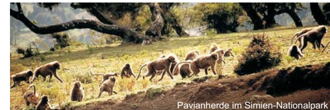
Pavianherde im Simien-Nationalpark

Lalibela, oder Neu-Jerusalem, bildet mit seinen berühmten Felsenkirchen einen weiteren Höhepunkt der Exkursion; wieder in Addis Abeba (Inlandsflug) Stadtrundfahrt sowie Besuch des Mercato, Afrikas größten Marktplatz; am späten Abend Rückflug nach Frankfurt (Ankunft am Morgen des 22. Tages)