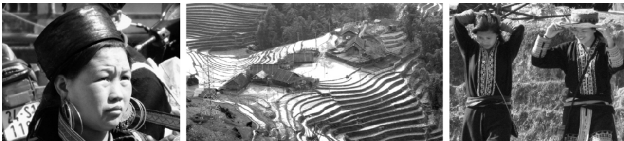
von links nach rechts: Hmong, aufwendige Reisterrassen im Muong Hoa-Tal, junge Dao in Ta Phin

Unterkunft im Zug (private Schlafkabine, DZ und EZ vorhanden), Hotels in Sa Pa, Tam Duong und Dien Bien Phu (je 1 Übernachtung)