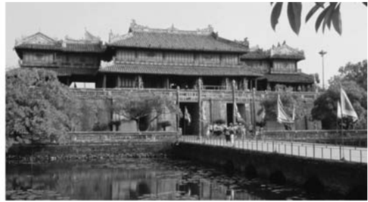
von links nach rechts: Balsambirne, Näherinnen in Hoi An, Kaiserstadt Hue

6. Tag: Hoi An, über Jahrhunderte eine der blühendsten Hafenstädte Vietnams; durch die engen Gassen der Altstadt (UNESCO-Welterbe) geht es unter anderem zum Tan Ky-Haus (eines der schönsten, rund 200 Jahre alten Kaufmannshäuser mit imposanten Schnitzereien und Einlegearbeiten), in ein chinesisches Versammlungshaus, zur japanischen Brücke und zur Phuoc Lam-Pagode (17. Jh.)