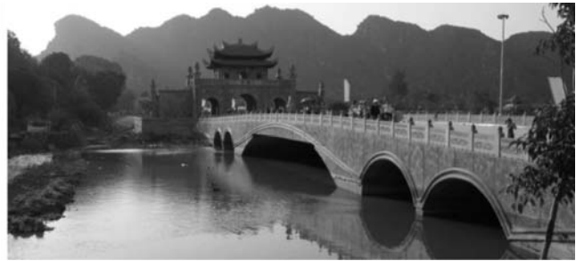
von links nach rechts: Dschunke in der Ha Long-Bucht, Brücke in Hao Lu (Trockene Ha Long-Bucht)

13. Tag: Mittags Flug mit Vietnam Airlines nach Hanoi und Fahrt durch das Delta des Roten Flusses in die Region östlich von Haiphong zur Einschiffung auf eine eigens für unsere Gruppe angemieteten Dschunke, auf der wir zu Abend essen, übernachten (private 2-Bett-Kabinen; als EZ eine eigene Kabine) und eine Fahrt durch die atemberaubende Karstlandschaft (UNESCO-Welterbe) der Ha Long-Bucht unternehmen