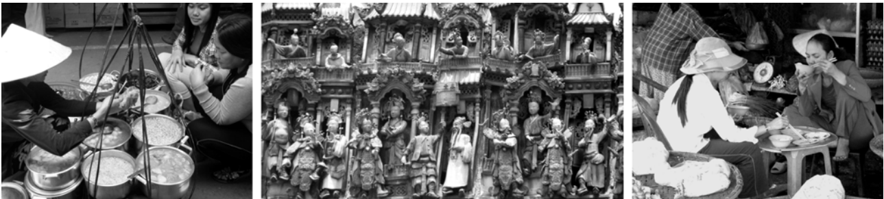
von links nach rechts: mobile Suppenküche, Details im Dach des Thien Hau-Tempels, gegessen wird immer und überall

■ Der besondere Reiz von Saigon (Ho Chi Minh-Stadt) liegt in seinen sehr unterschiedlichen Stadtvierteln, die zur heutigen Metropole des Südens (rd. 3,5 Mio. Einwohner) zusammengewachsen sind. Die drei ursprünglichen Stadtkerne haben bis heute ihren jeweiligen Charme bewahrt: besticht das ehemals französische Zentrum (das eigentliche Saigon) mit typischen Bauwerken im Kolonialstil, zeigen das benachbarte Chinesenviertel (Cholon) und die vietnamesische Siedlung (Gia Dinh), angefangen von der Bebauung bis zum Alltagsleben auf der Straße, jeweils die typischen Eigenarten ihrer Bewohner. Überprägt wird die Stadt heute durch spiegelverglaste, modernste Bauten als Zeichen des jüngsten wirtschaftlichen Booms, während zahlreiche Obdachlose, in der Hoffnung auf Arbeit in die Stadt gewanderte Bewohner des ländlichen Umlands, die Schattenseite des Aufschwungs sichtbar werden lassen.