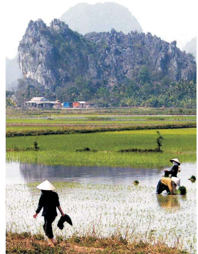
Karstlandschaft bei Hai Phong