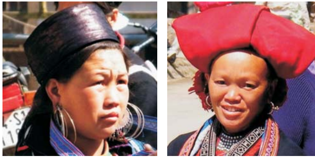
Vielvölkerstaat: Hmong (links) und Dao (rechts) im Nordwesten Vietnams

Nach der Anmeldung zu dieser Exkursion wird mit der von GEOPULS zugesandten Buchungsbestätigung eine Anzahlung (15 % des Reisepreises) fällig. Die Restzahlung erfolgt zwei Wochen vor Reisebeginn. Es gelten die Geschäftsbedingungen des Veranstalters: Geopuls-Studienreisen, Neckarhalde 62, 72108 Rottenburg a.N. (Tel. 07472-9808802). Die Allgemeinen Reisebedingungen werden gerne vorab zugeschickt oder können auf/von der Geopuls-Homepage www.geopuls.de eingesehen oder ausgedruckt werden.