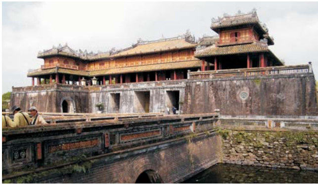
Kaiserpalast in Hue: Mittagstor