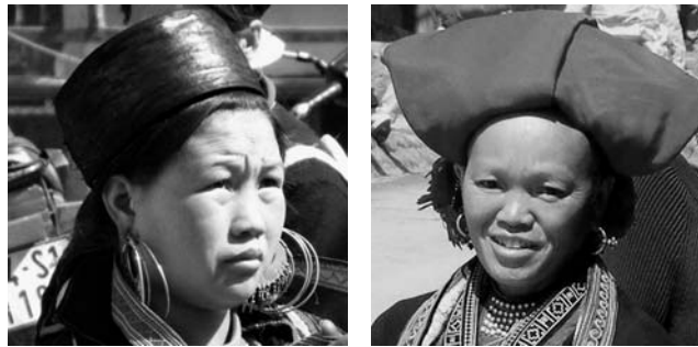
Vielvölkerstaat: Hmong (links) und Dao (rechts) im Nordwesten Vietnams