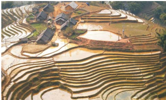
Reisterrassen im Muong Hoa-Tal

Mit einer phantastischen Natur und kulturell so unterschiedlichen wie spannenden Regionen, bietet Vietnam eine außerordentliche Vielfalt. Die Exkursion umfaßt deshalb, neben den genannten Zentren, sowie der Delta-Landschaft des Mekong mit seinen zahlreichen Wasserläufen und der Halong-Bucht mit ihren atemberaubenden Karstlandschaften im Delta des Roten Flusses, unter anderem auch kleine Dörfer im Trung Son-Gebirge (Süd- und Zentralvietnam) und im nördlichen Gebirgsland an der Grenze zu China. In diesen Rückzugsgebieten treffen wir auf zahlreiche ethnische Minderheiten, von den Mon und Khmer im Süden bis zu den Hmong, Dao und Tai-Völkern im Norden. Die Kaiserstadt Hue, Altstadt von Hoi An und die Tempelstadt My Son findet man dabei ebenso auf der UNESCO-Welterbeliste wie die Zitadelle von Hanoi und die Halong-Bucht.