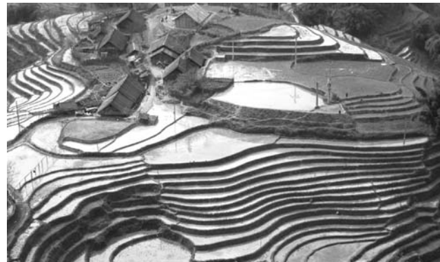
Reisterrassen im Muong Hoa-Tal

Nach der Anmeldung zu dieser Exkursion wird mit der von GEOPULS zugesandten Buchungsbestätigung eine Anzahlung (15 % des Reisepreises) fällig. Die Restzahlung erfolgt zwei Wochen vor Reisebeginn. Es gelten die Geschäftsbedingungen des Veranstalters: Geopuls-Studienreisen, Neckarhalde 62, 72108 Rottenburg a.N. (Tel. 07472-9808802). Die Allgemeinen Reisebedingungen werden gerne vorab zugeschickt. Sie können bei der VHS eingesehen, oder auch von der Homepage www.geopuls.de ausgedruckt werden.