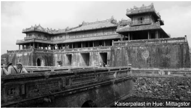
Kaiserpalast in Hue: Mittagstor