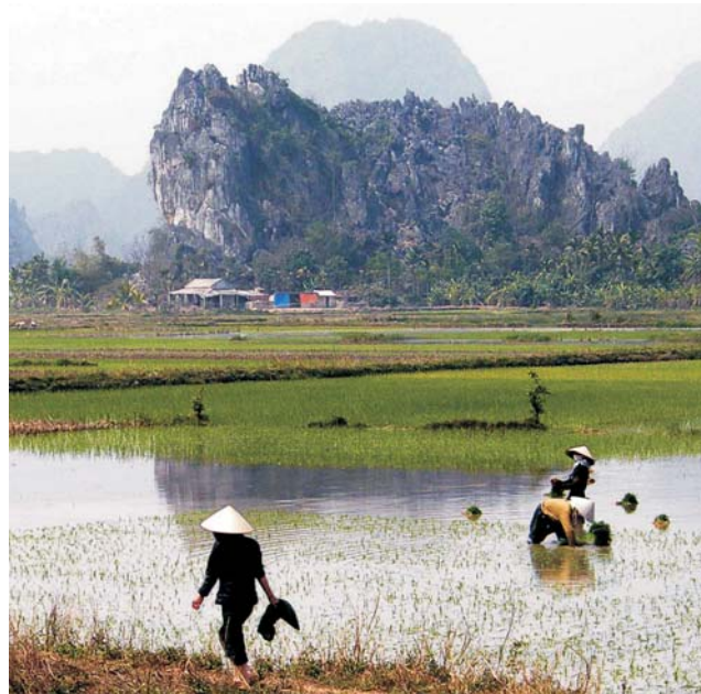
Karstlandschaft bei Hai Phong

dieser Folder wurde CO 2 -neutral hergestellt