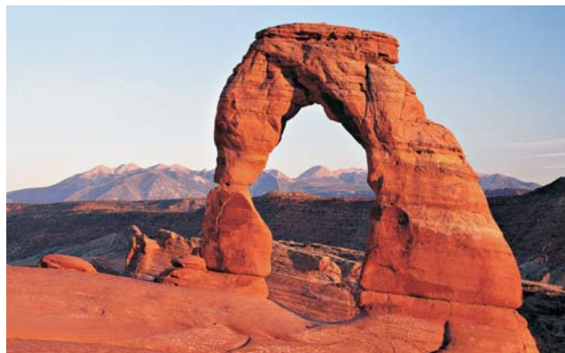
Arches Nationalpark, Utah im Norden des Colorado-Plateaus