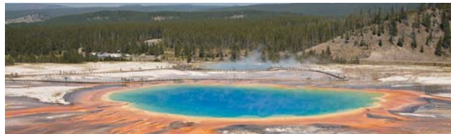
Die faszinierenden Geysirwelten des Yellowstone Nationalpark

GEOPULS bietet, in Zusammenarbeit mit der VHS, Studienreisen für Menschen, die zu gleichen Teilen Kultur und Natur eines Landes in einer überschaubaren Gruppe Gleichgesinnter kennen lernen möchten. Alle Geopuls-Exkursionen werden von begeisterten Geographen geleitet, die sowohl zum Naturraum als auch zur Kultur eines Landes aufgrund Ihrer Ausbildung und Erfahrungen wirklich etwas zu sagen haben. Als Reiseveranstalter wurde Geopuls 2004 aus dem Geographischen Institut der Uni Tübingen gegründet. Das Reisekonzept ist, ein Land umfassend, möglichst authentisch, und auch einmal mit anderen Themen als sonst üblich intensiv erlebbar zu machen. Dabei sind Geographen Genießer und schenken dem Landestypischen, Kunst, Kultur und Geschichte ebensoviel Aufmerksamkeit wie den Schönheiten und dem Verständnis der Natur. Kleine Wanderungen und Ausflüge mit Themen auch zur Geologie, Ökologie, Vegetation und Landschaftsentstehung, für jedermann leicht verständlich dargeboten, fehlen deshalb bei keiner Reise.