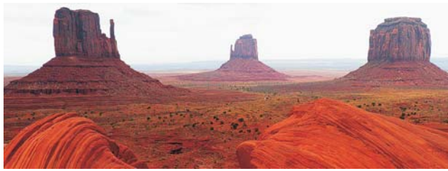
Monument Valley, Navajo Tribal Park

Nach der Anmeldung zu dieser Exkursion wird mit der von GEOPULS zugesandten Buchungsbestätigung eine Anzahlung (15 % des Reisepreises) fällig. Die Restzahlung erfolgt zwei Wochen vor Reisebeginn. Es gelten die Geschäftsbedingungen des Veranstalters: Geopuls-Studienreisen, Neckarhalde 62, 72108 Rottenburg a.N. (Tel. 07472-9808802). Die Allgemeinen Reisebedingungen werden gerne vorab zugeschickt. Sie können bei der VHS eingesehen, oder auch von der Homepage www.geopuls.de ausgedruckt werden.