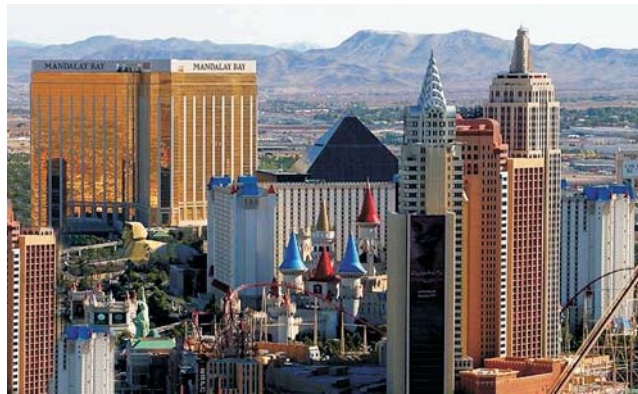
Las Vegas - flimmernde Spielerstadt in der Wüste von Nevada

dieser Folder wurde CO 2 - neutral hergestellt