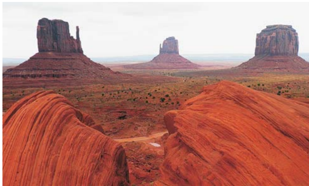
Monument Valley, Navajo Tribal Park

Nach der Anmeldung zu dieser Exkursion wird mit der von GEOPULS zugesandten Buchungsbestätigung eine Anzahlung (15 % des Reisepreises) fällig. Die Restzahlung erfolgt zwei Wochen vor Reisebeginn. Es gelten die Geschäftsbedingungen des Veranstalters: Geopuls-Studienreisen, Neckarhalde 62, 72108 Rottenburg a.N. (Tel. 07472-9808802). Die Allgemeinen Reisebedingungen werden gerne vorab zugeschickt oder können auf der Homepage www.geopuls.de eingesehen und ausgedruckt werden.