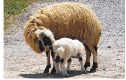
Bilder von links nach rechts: Heilig Kreuz-Kirche Ahtamar; Götterköpfe auf dem Nemrud Dagı; Schafe bei Hosap