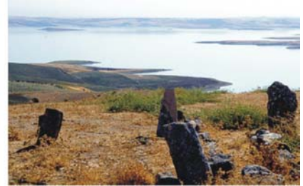
Bilder von links nach rechts: Gümruk-Hani-Tavla-Spieler in Ufra; Alte Brücke von Hasankeyf; Atatürk-Stausee