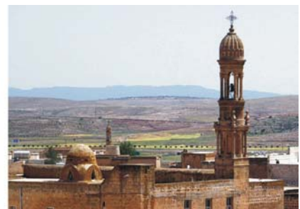
Bilder von links nach rechts: Knoblauchverkäufer auf dem Basar in Ufra; Landschaft von Zerneq Barajji; orthodoxe Kirche Mor Sharbel in Midyat