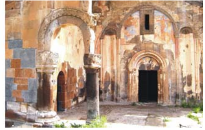
Bilder von links nach rechts: Ishak Paşa Sarayı Palast; schneebedeckter Gipfel des Ararat; Gregorkirche Tigran Honentz in Ani