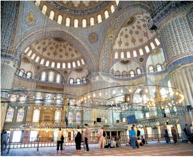
Gebetssaal der Blauen Moschee