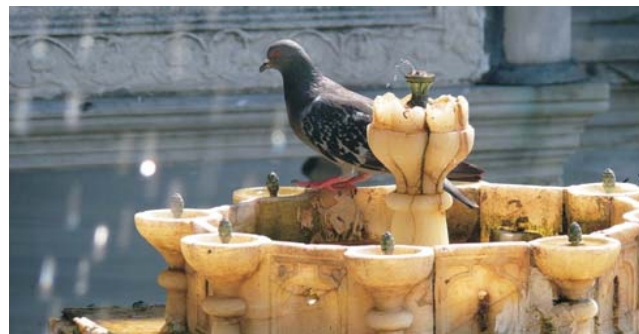
beschauliche Szene an einem Brunnen im Topkapi Sarayi

GEOPULS als Reiseveranstalter wurde 2004 von Dozenten des Geographischen Instituts in Tübingen gegründet. Durch die Zusammenarbeit mit der VHS bietet sich Ihnen die Gelegenheit, mit uns ein Land intensiv, möglichst authentisch und geographisch ganzheitlich zu erleben. Nicht Reiseleiter von Beruf, sondern begeisterte Geographen und Landeskundler, die sich durch eigene Arbeiten und Erfahrungen im jeweiligen Land bestens auskennen, bilden die Mannschaft von Geopuls. Das Kennenlernen von Kultur und Menschen ist nur die eine Hälfte einer Reise mit Geopuls. Ebensoviele Aufmerksamkeit schenken wir stets der Landesnatur. Ausflüge und kleine Wanderungen in die Natur gehören deshalb zu jeder Reise dazu, um die Besonderheiten von Landschaft, Vegetation, Klima, usw. verstehen und hautnah erleben zu können. Die Gruppengröße ist bewusst stets überschaubar.