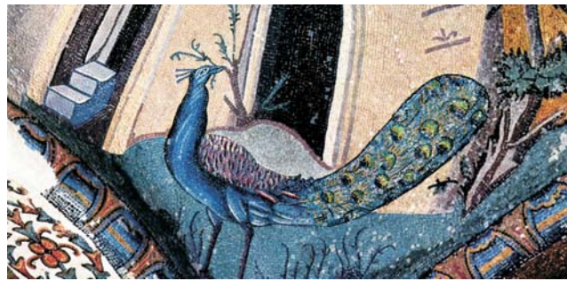
In der Chora Kirche im Stadtteil Fatih wird das christliche Byzanz lebendig. Die Mosaiken und Fresken im Inneren zählen zu den bedeutendsten weltweit.

dieser Folder wurde CO 2 - neutral hergestellt