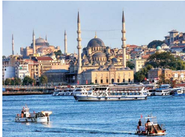
Blick vom Goldenen Horn zur Hagia Sofia links und Neuer Moschee (rechts)

Istanbul, die alte Metropole am Bosphorus zählt zu den interessantesten Städten des Vorderen Orients. Wo die 30 km lange, max. 12 m tiefe und bis 3 km breite Meerenge des Bosphorus die Landbrücke zwischen Asien und Europa durchschneidet, breitet sich mit unbeschreiblicher Betriebsamkeit unaufhaltsam wachsend eine der faszinierendsten Städte der Welt aus. Einmalig in ihrer Lage, einmalig in ihrer Geschichte und einmalig in ihrer materiellen Kultur aus über zwei Jahrtausenden: Byzanz, Konstantinopel, Istanbul. Als Brücke zwischen Orient und Okzident spiegelt sie nicht nur eine unglaubliche Fülle verschiedenster Kultureinflüsse, sondern ist zugleich ein Spiegelbild der Geschichte und Kultur des Osmanischen Reiches und der modernen Türkei. Dieser Ort war und ist pulsierender Schmelztiegel der Völker, war immer Mittler zwischen den Welten des orientalisches-islamischen Kulturkreises und des christlichen Abendlandes. So versteht die Stadt sich auch