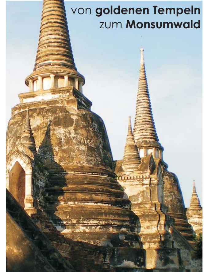
Ayutthaya: Pagoden des Wat Phra Si Sanphet