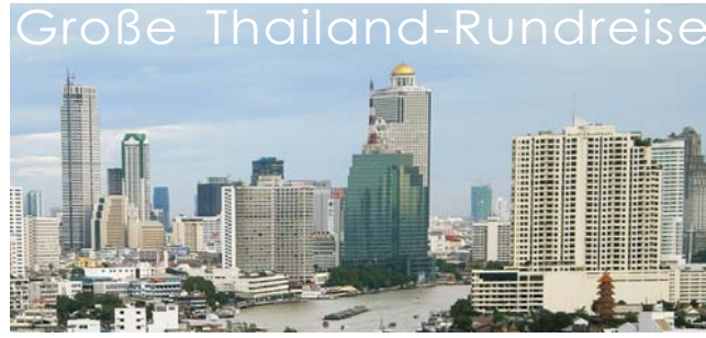
Bangkok, die 12-Millionen-Metropole am Chao Phraya

Nach der Anmeldung zu dieser Exkursion wird mit der von GEOPULS zugesandten Buchungsbestätigung eine Anzahlung (15 % des Reisepreises) fällig. Die Restzahlung erfolgt zwei Wochen vor Reisebeginn. Es gelten die Geschäftsbedingungen des Veranstalters: Geopuls-Studienreisen, Neckarhalde 62, 72108 Rottenburg a.N. (Tel. 07472-9808802). Die Allgemeinen Reisebedingungen werden gerne vorab zugeschickt. Sie können bei der VHS eingesehen, oder auch von der Homepage www.geopuls.de ausgedruckt werden.