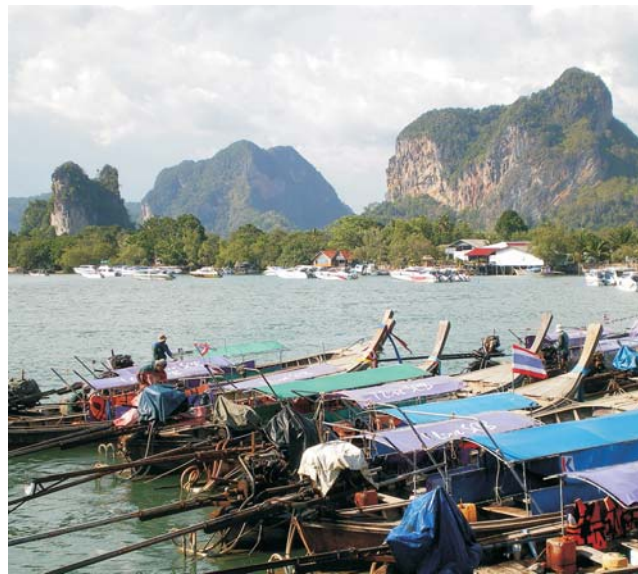
Landschaftselemente in Süd-Thailand: Karst, Mangroven und Meer

dieser Folder wurde CO 2 -neutral hergestellt