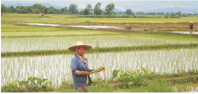
Reisfelder in Nordthailand