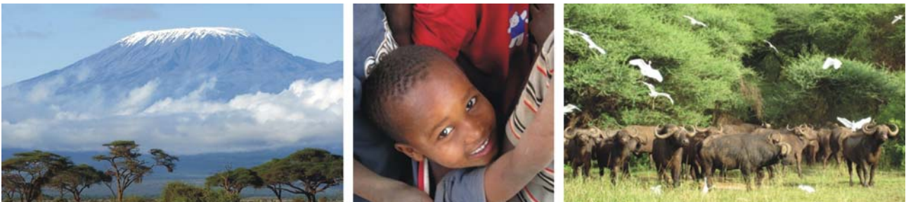
von links nach rechts: Kilimandscharo, Massai-Junge, Wasserbüffel und Reiher