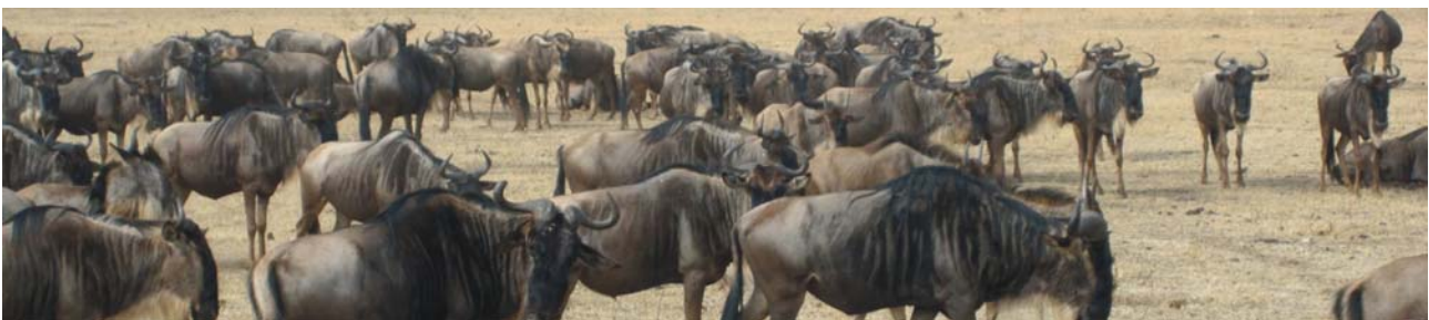
Gnu-Herde auf Wanderung am Ende der Trockenzeit im Ngorongoro-Krater

Wer an Tansania denkt, dem sind die Serengeti und der Kilimandscharo, mit 5895 m der höchste Berg Afrikas, ein Begriff. Mit dem Ostafrikanischen Grabenbruchsystem sind fantastische Landschaften, mit großen Seen und Vulkankratern, verbunden, die ihresgleichen suchen. Hier ist auch die Wiege der Menschheit - in der Olduvai-Schlucht wurden die Überreste der ersten Menschen und ihre Werkzeuge gefunden. Die endlos erscheinenden Savannen der Serengeti sind die Heimat gewaltiger Tierherden. Mächtige Elefanten am Wasserloch, Löwen, oder eindrucksvolle Affenbrotbäume - hier treffen Sie auf alles, was Tier- und Pflanzenwelt in Ostafrika zu bieten hat. Ob in der äußerst dünn besiedelten Serengeti oder am Fuße des Kilimandscharo, genauso abwechslungsreich wie das Land ist auch die Bevölkerung, von den Massai bis zu den rund 120 verschiedenen Bantu-Stämmen, die insgesamt über 90 % der Bevölkerung ausmachen.