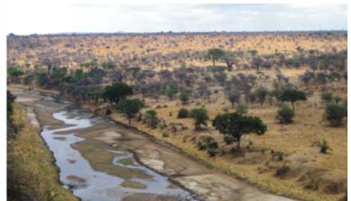
von links nach rechts: Soda-See Lake Manyara, junger Pavian im Ngorongoro Nationalpark, Targire Fluss in der Massai-Steppe (Savanne)