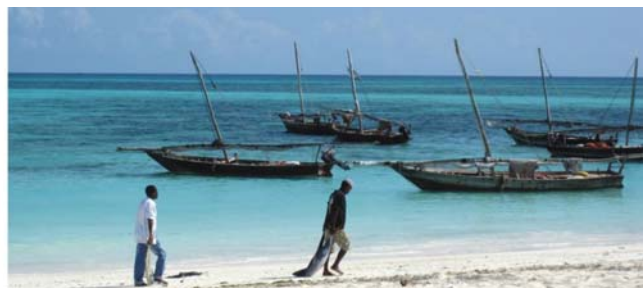
Sonnenuntergang und Fischerboote am Strand zum Indischen Ozean auf Sansibar