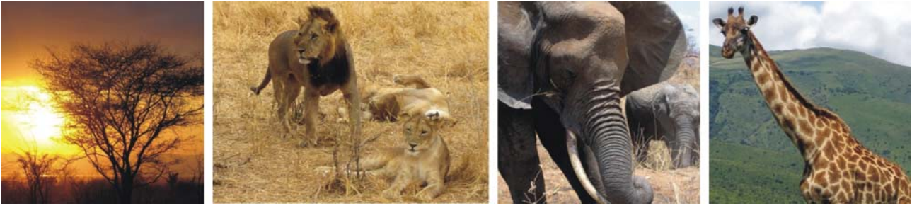
von links nach rechts: Sonnenuntergang am Lake Manyara; Löwen, Elefanten und Giraffen sind nur einige Vertreter des Wildreichtums der Serengeti

Die Flussebene des Seronera im Herzen des Serengeti Nationalparks, bildet ein dauerhaftes Refugium für Tiere, die nicht über solche Wegstrecken hinweg wandern. Mehrere Flussadern durchziehen das Tal und gewährleisten ganzjährig Wasser. So gesellen sich zu den Gnus und Zebras v.a. Antilopen (Impalas, Topis und die größte Antilopenart der Welt, die Elenantilope) sowie zahlreiche Gazellen (u.a. Thompsongazelle und Grantgazelle). Sie bilden wiederum die Nahrungsgrundlage für zahlreiche Raubtiere. So ist hier die Dichte an Leoparden, Geparden, Hyänen und Löwen besonders hoch. Auch die kleineren Jäger sind hier zu finden: Schakale, Mangusten, Servale und der Löffelhund. Dieser hat der Seronera seinen Namen gegeben – das Massaiwort siron bedeutet soviel wie: der Ort des Löffelhundes.