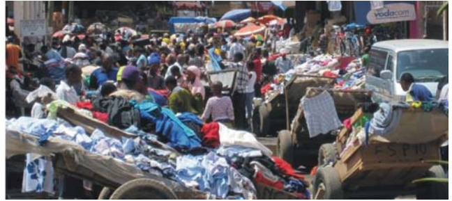
von links nach rechts: Termitenhügel in der Savanne, Kleidermarkt in Arusha